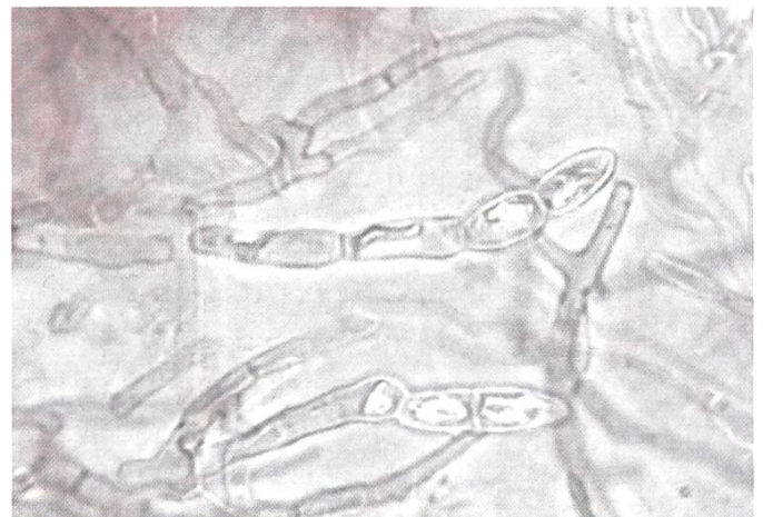
Russula convivialis Kutikula: Dermatozysten und Haare | Cuticola: dermatocistidi e peli | Cuticule: dermaocystides et poils