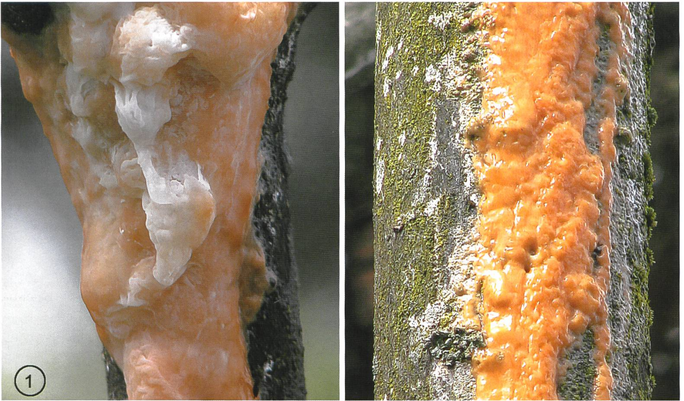
Die Pionnotes Konidienform eines Ascomyceten aus der Familie der Nectriaceen ist ein Schleim. Auf einem Strauch einer exotischen Cornus -Art in einem Garten in St. Sulpice bei Lausanne. Der Stamm rechts ist etwa armdick.