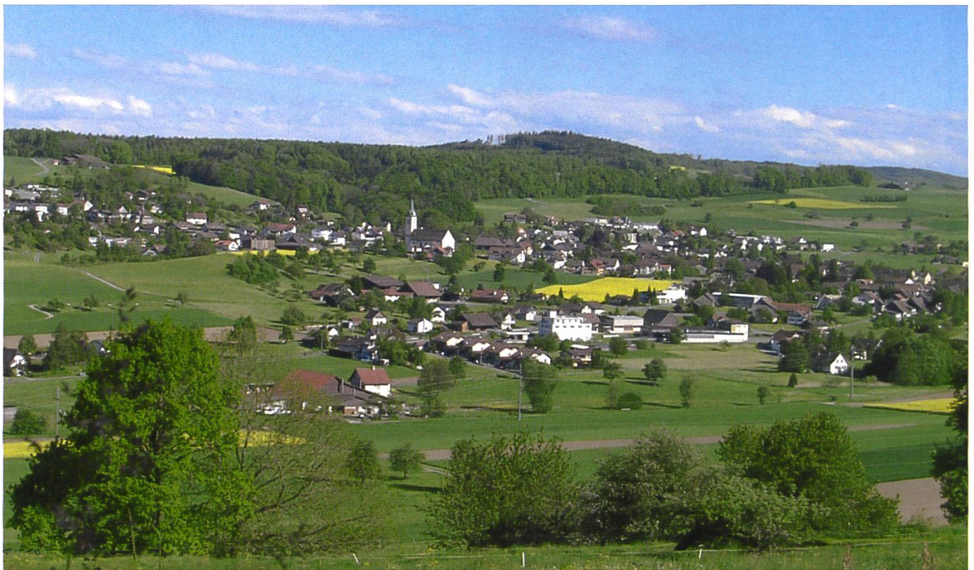
Sicht auf | Vue de Sarmenstorf

Bedeutende Funde aus der Vor- und Frühgeschichte weisen darauf hin, dass das Gemeindegebiet von Sarmenstorf schon seit dem Neolithikum dauernd besiedelt war. Im «Zigi» wurden mehrere Grabhügel aus der Zeit um 2200 v. Chr. ausgegraben. Im «Murimooshau» konnte die zu einer römischen Villa gehörende Badeanlage aus dem ersten nachchristlichen Jahrhundert konserviert werden.