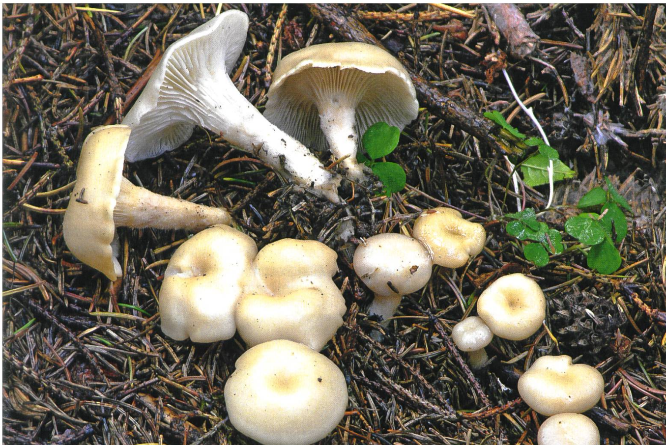
Clitocybe ditopa (Fr.) Gillet Bereifter Mehl-Trichterling | Clitocybe à odeur de farine rance