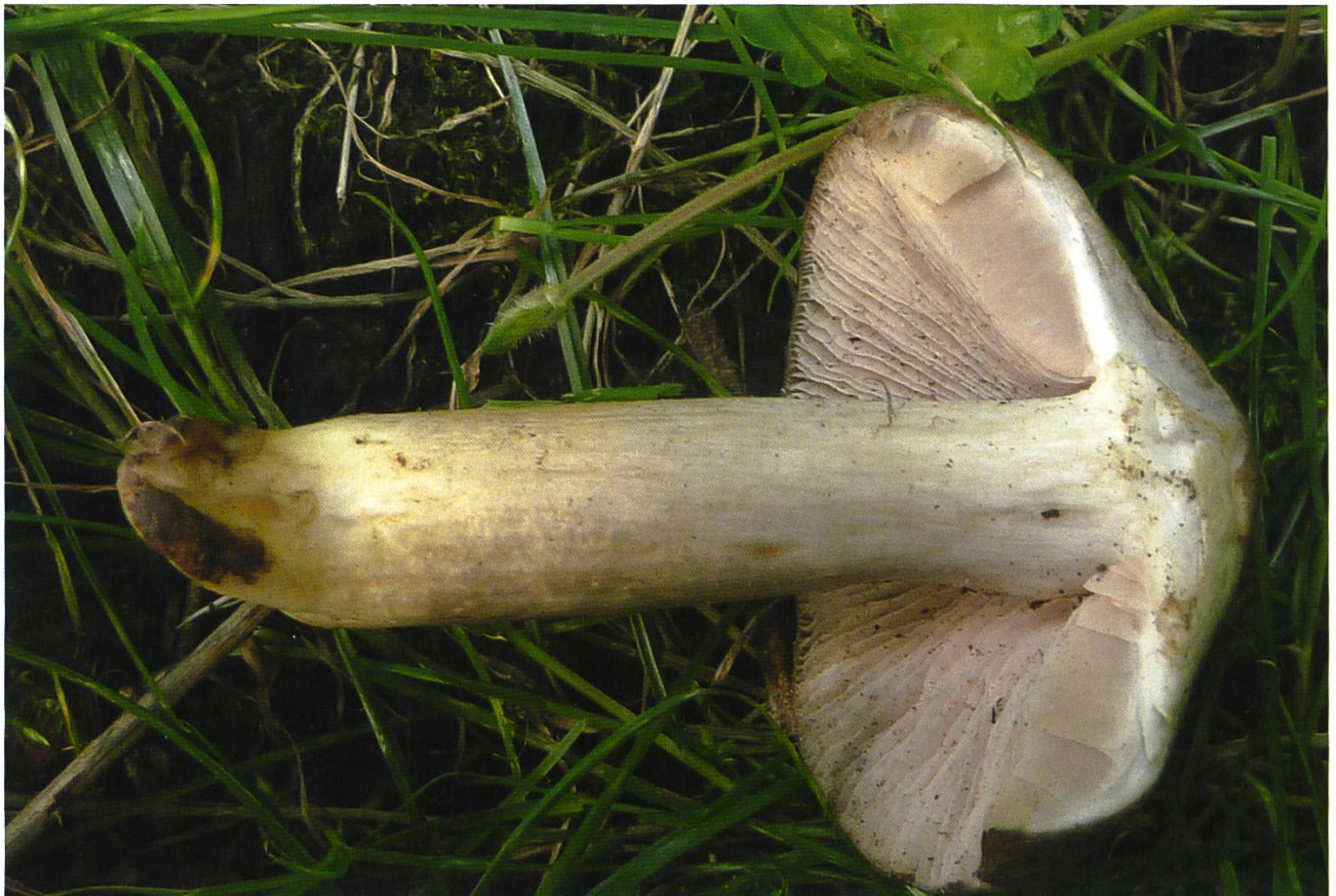
Entoloma luteobasis Fruchtkörper

Lamellen > Eng stehend, Schneiden häufig scharf; Lamellenfarbe erst weiss, dann grau-oliv und allmählich mit Heranreifen der Sporen in ein Rosa übergehend.