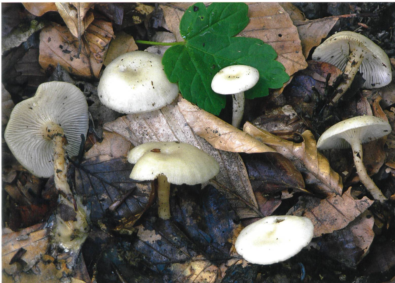
Clitocybe phaeophthalma (Pers.) Kuyper Bitterer Trichterling | Clitocybe à odeur de poulailler