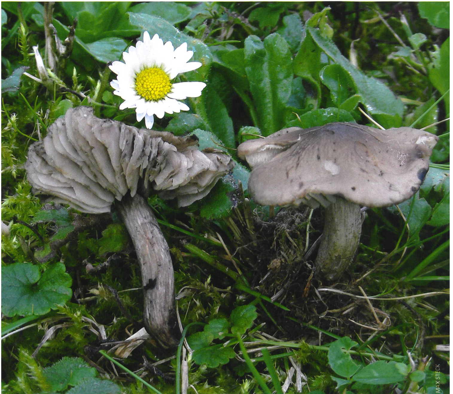
Dermoloma magicum Fruchtkörper

ten Herbst, anlässlich der Studienwoche 2011 in Escholzmatt, fand Stefan Blaser diese Art wieder, dank dem Schlüssel von Gröger (2006) war nun eine Bestimmung möglich.