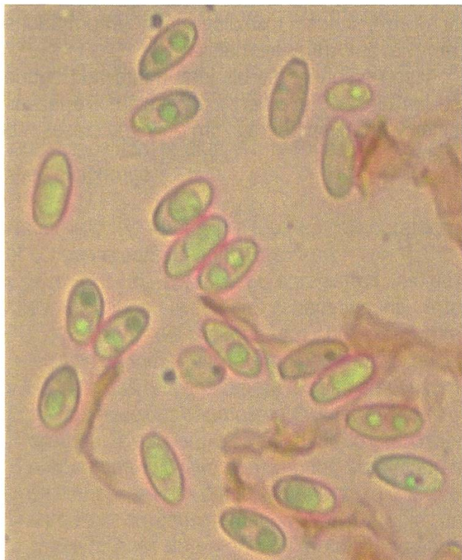
Rhizopogon marchii Sporen | Spores

C'est un bulbe en forme de truffe qui a éveillé mon attention, à plus de 2000 m d'alt. lors d'une randonnée de printemps, fin mai 2011, dans l'Engadine. Au toucher, il en sortait une substance brun olivâtre. S'agissait d'une espèce de truffe que l'hiver avait congelée? En éloignant avec prudence les aiguilles de sapins de l'endroit de la découverte, je trouvais encore quatre autres champignons hypogés avec leur périidium déchiré. Délicatement, j'ai prélevé les spécimens. Les endroits recouverts de terre étaient encore blancs, mais au contact, ils changeaient de couleur en devenant roses à nettement rouge sang.