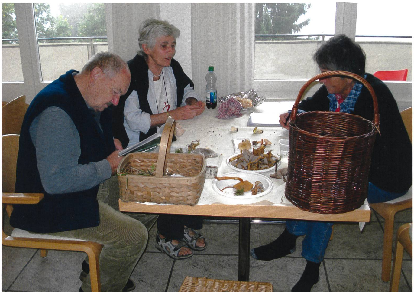
Pilze bestimmen Fachliteratur wälzen, das gehört bei den Vereinsmitgliedern zum festen Jahresprogramm

26 Interessierte gründeten 2002 den Verein, bei dem nebst der Vermittlung von Fachwissen auch die Geselligkeit nicht zu kurz kommen sollte – ein Konzept, das offensichtlich Anklang fand. Heute zählt der Verein 142 eingetragene Mitglieder. Und denen wird Jahr für Jahr viel geboten. Zentral sind die pilzkundlichen Exkursionen, die aus interessierten Pilzern fachkundige und kompetente Sammler machen, die sich nicht nur in der Pilzkunde auskennen, sondern auch im Naturschutz bestens Bescheid wissen. Deshalb wird im Frühling jeweils auch eine «Pflanzenwanderung» angeboten, bei der allerdings nicht die Pflanzen sondern eine grosse Schar Interessierter unter Leitung eines Biologen zu abgelegenen Fundorten wandern, wo spezielle Pflanzen bestimmt werden.