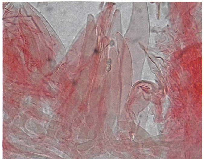
Pluteus favrei Cystiden | Cystides

Die Bestimmung dieses Pilzes ist nicht einfach, die Literatur ist sehr widersprüchlich. Meistens wird er mit Pluteus leoninus synonymisiert. Im Pilzkompodium Band 2 von Erhard Ludwig ist unter Pluteus leoninus eine schöne Abbildung (97.24.c). Bei der Sporengrösse bemerkt er: «Sporen bei Antonin & Skubla (Fungi Non Delineati) für P. favrei grösser 7–9 (–9,5)×6–7 (–7,7) µm», was mit meiner Kollektion besser übereinstimmt. Auch sind die Sporen rundlicher bis breit elliptisch. Ausschlaggebend für die Bestimmung war die Fundmeldung von Markus Wilhelm (2001). Die gute Abbildung und die Bemerkung zum Standort (auf Nadelholz Fichte/Tanne) in montanen Lagen legt den Schluss nahe, dass es sich um Pluteus favrei handelt.