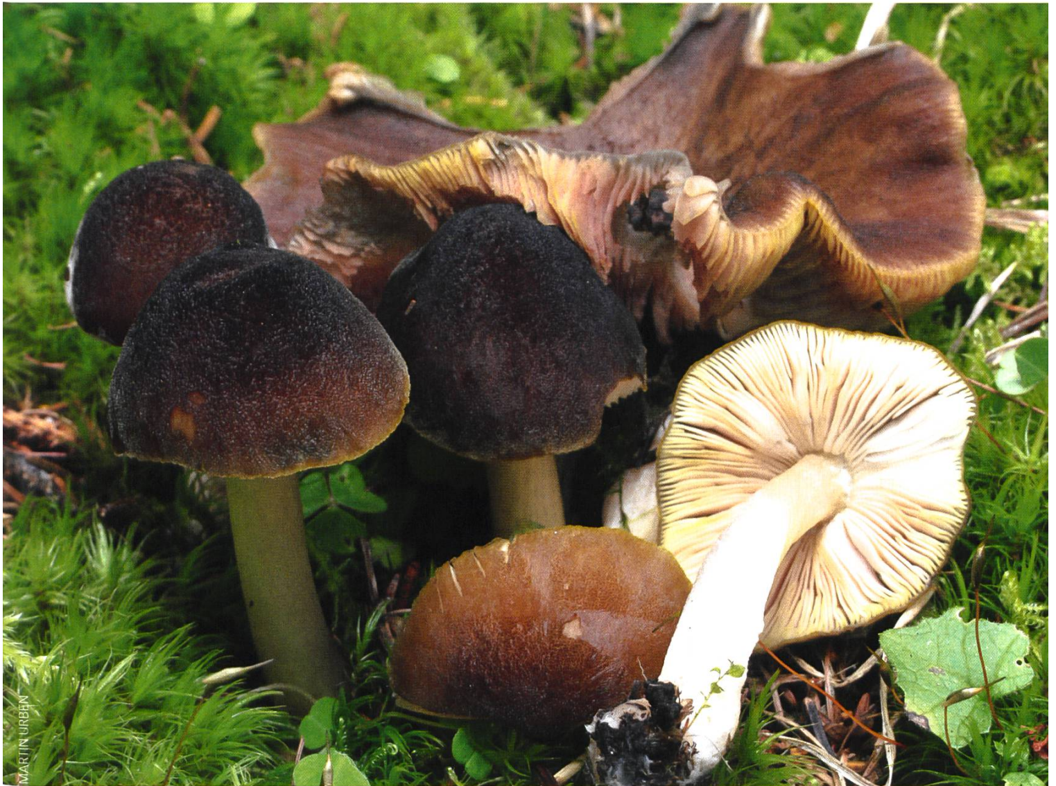
Pluteus favrei Fruchtkörper | Fructifications

deckt man immer wieder verschiedene Pilzarten auf morschem Holz. Da überrascht es nicht, dass man manche Raritäten bestaunen kann. Einige Beispiele: Gyromitra gigas , Gyromitra geogenia , Pseudorhizina sphaerospora , Cortinarius mirandus , Mycena viridimarginata , Phyllotopsis nidulans u.a. In diesem Gebiet habe ich im letzten Jahr einen Dachpilz gefunden, den ich nun vorstellen möchte.