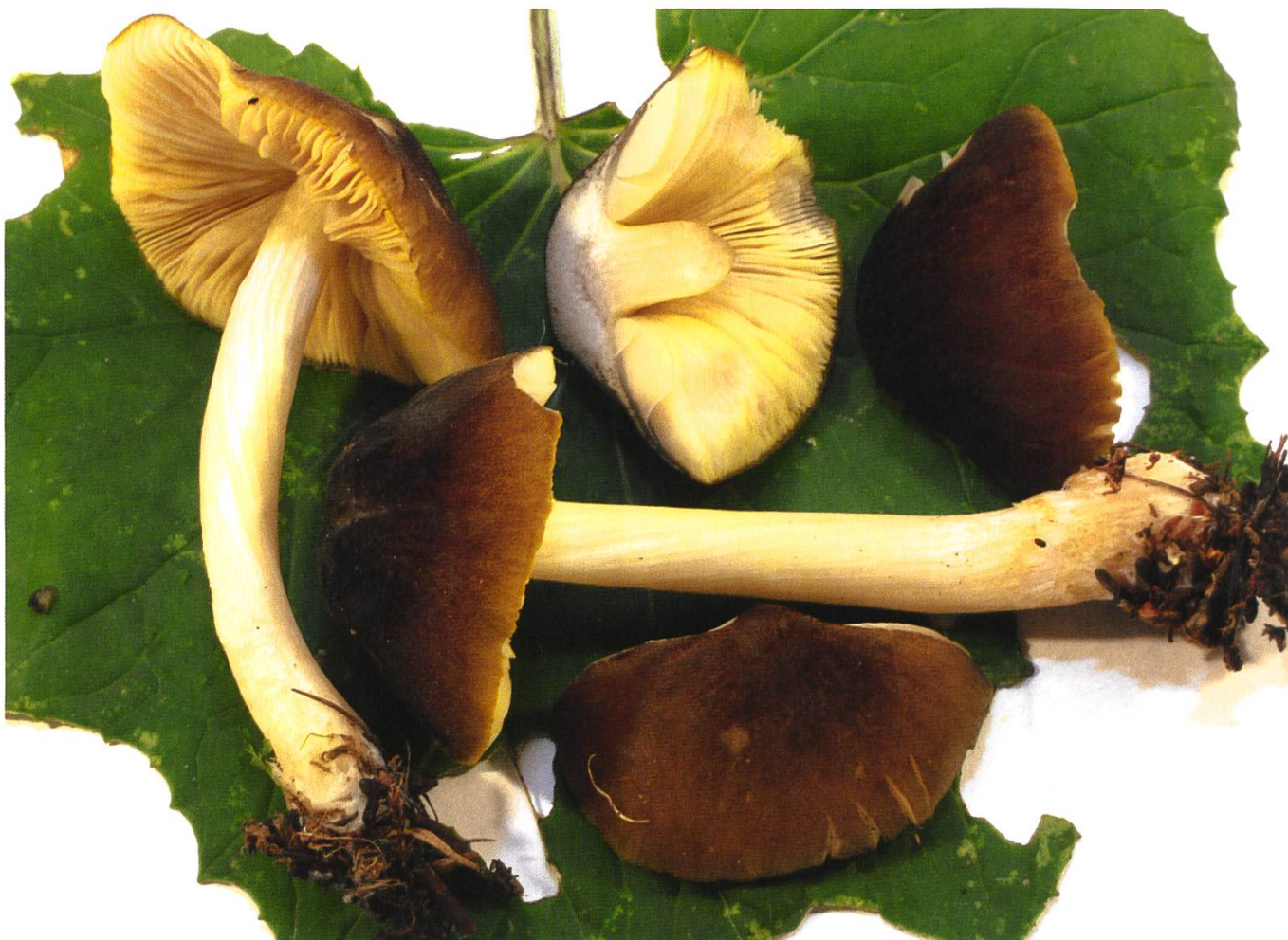
Pluteus favrei Fruchtkörper | Fructifications

Lamelles > Jeunes blanchâtres à crème, puis roses, larges, libres. Marge des lamelles jeunes déjà jaune d'or, puis décolorantes, finement ciliées.