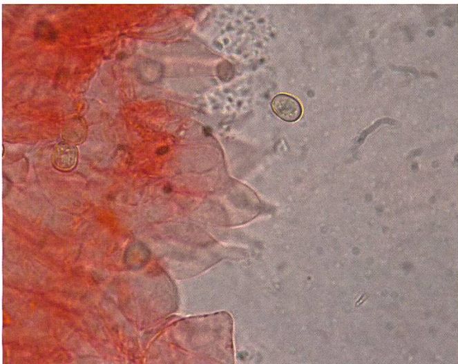
Pluteus favrei Sporen | Spores

Stiel > 40–80×5–10 mm, zylindrisch, jung voll, alt markig hohl, brüchig, gegen Basis verdickt bis leicht keulenförmig. Oberfläche glatt, weiss-gelblich bis gelb, längs überfasert. Auffallend ist die Drehwüchsigkeit des Stiels bei jedem Exemplar.