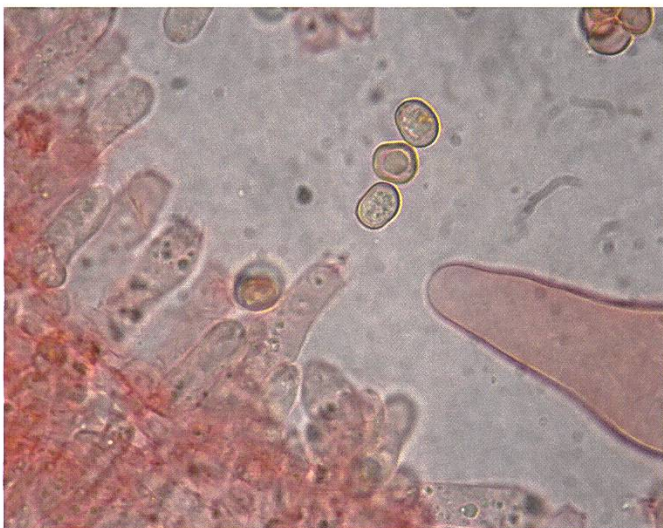
Pluteus favrei Basidien und Sporen | Basides et spores

Sporen > Rundlich bis breit elliptisch, glatt, einzelne mit einem Tropfen, dünnwandig. 7,5–9×5,5–7,5 µm. Q-Wert: 1,21. Sporenpulver: rötlichocker bis braunrot.