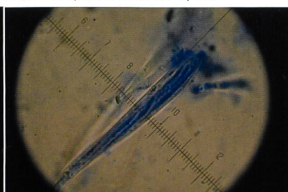
COLPOMA CRISPUM Asco con spore | Ascus mit Sporen