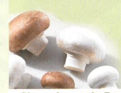
Champignon de Paris