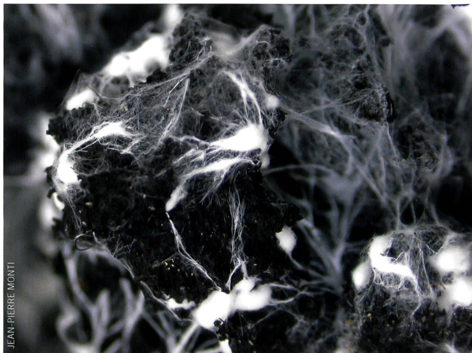
Abb. 4 Primordien des Champignons ( Agaricus bisporus ) Fig. 4 primordia d' Agaricus bisporus

Im Substrat sondert das Myzelium Enzyme ab, die ihm ermöglichen, einen bestimmten Teil davon zu verdauen, sich davon zu ernähren und zu wachsen. Gleichzeitig stellt es verschiedenen Bodenorganismen und der Vegetation Nahrung bereit. Weil die meisten Pilzarten sehr selektive Enzyme absondern, die nur spezielle Substrate abbauen können, leben viele Pilze nur in genau definierten Lebensräumen.