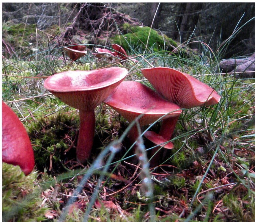
Fig. 1 Lactarius rufus , dans la mousse Abb. 1 Der Rotbraune Milchling ( Lactarius rufus ) im Moos

En réalité, la partie la plus importante, mais cachée d'un champignon est le mycélium*, contenu dans le substrat, soit dans de la terre, dans de l'humus, dans de la matière organique en décomposition ou parfois même dans des êtres vivants. Le mycélium* est formé de très longues et étroites cellules cylindriques, les hyphes* dont l'épaisseur est très souvent inférieure à 1/100 mm. Vu leur épaisseur microscopique, les hyphes