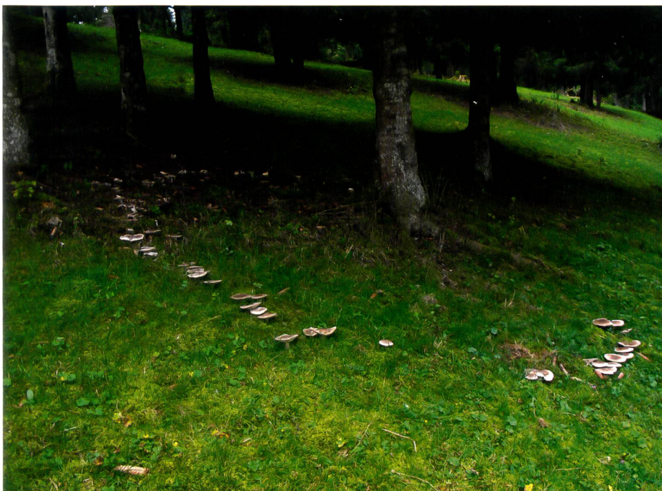
Abb. 5 Hexenring einer Nebelkappe ( Clitocybe nebularis ) Fig. 5 rond de sorcière de Clitocybe nebularis

100 Mio. Kilometer = Länge aller Zellen eines Myzels einer Rasenfläche von 50 x 50 m (2500 m 2 ), damit könnte man die Erde 2000 Mal umrunden!