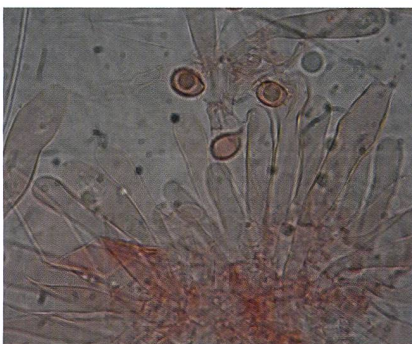
RUSSULA FAVREI Hymenium im Kongorot | Hyménium dans le rouge congo