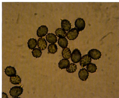
RUSSULA FAVREI Sporen in Melzer | Spores dans le Melzer

Il m'est possible de désigner un partenaire mycorhizien sans équivoque. Les mélèzes et les épicéas ont poussé dans la proximité immédiate de chaque station. Sur l'alpage moussu de Törvel VS, j'ai récolté également R. favrei dans des forêts de pins et de mélèzes à presque 2000 m d'altitude.