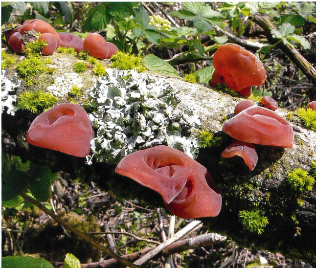
AURICULARIA AURICULAE-JUDAE Judasohr | Oreille de Judas