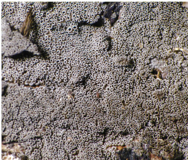
STIGMATOLEMMA URCEOLATUM Napfförmiges Stromabecherchen