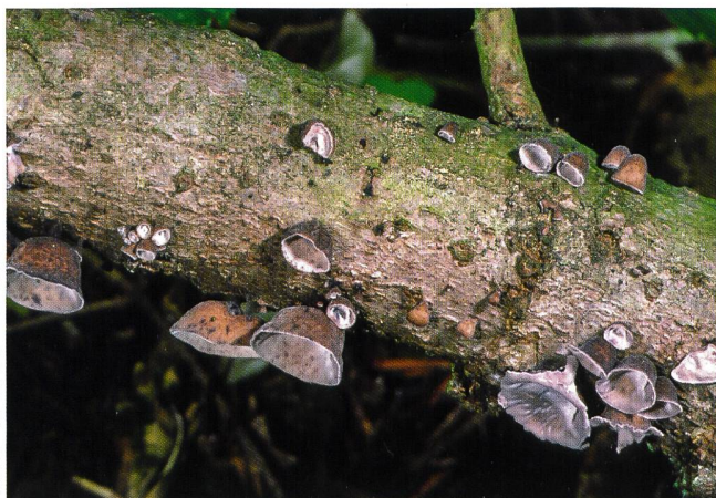
CYPHELLA DIGITALIS Tannen-Fingerhut