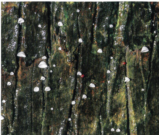
LACHNELLA? aus dem Masoala-Regenwald im Zoo Zürich