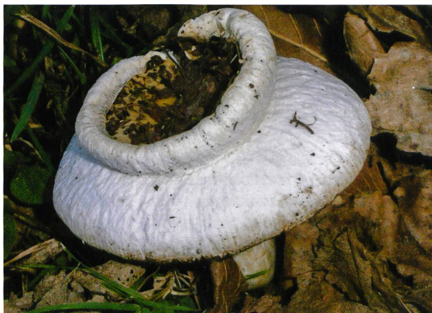
RUSSULA SP. (sopra) E CORTINARIUS SP. (sotto)