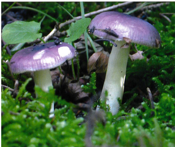
Abb. 23 Hohlstieliger Täubling ( R. cavipes )