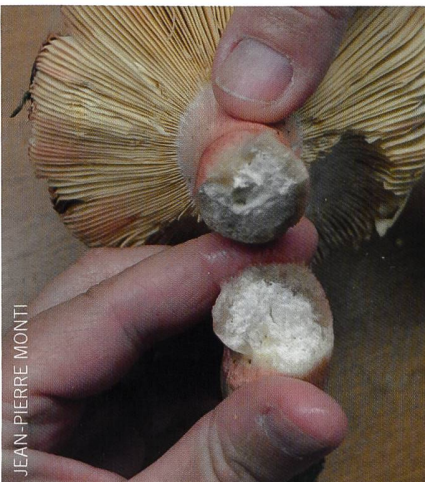
Fig. 2 Chez les Russulales, chair du pied cassante comme de la craie | Abb. 2 Bei den Täublingsartigen bricht das Stielfleisch wie Kreide.