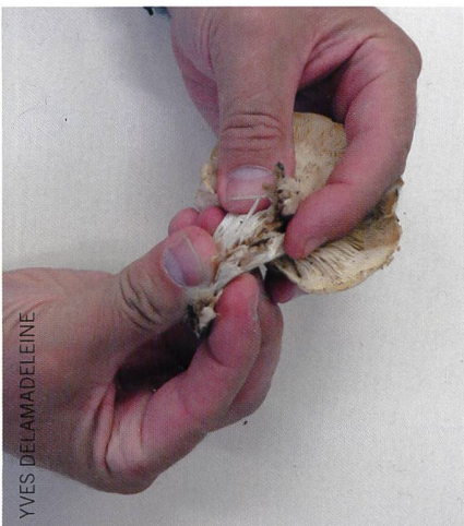
Fig. 3 Chez les Agaricales, chair du pied filandreuse, ne se cassant pas facilement | Abb. 3 Bei den Agaricales ist das Stielfleisch faserig und bricht nicht einfach.