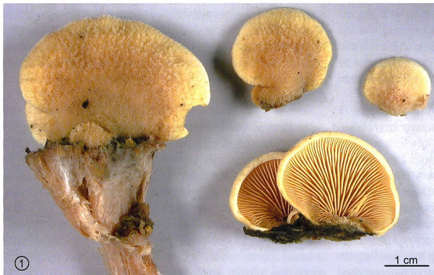
Abb. 1 Fruchtkörper des Orangeseitlings; das Exemplar ganz links sitzt auf einem Stück Holz, das auf seiner Bruchfläche das blasse Mycelium erkennen lässt.

gezeigt, und schliesslich sieht man in der Abbildung 4 die wichtige, oft unbemerkte und auch kaum bekannte Schleimhülle der Hyphen, mit deren Hilfe die Hyphe das Substrat, hier die Wand einer Holz-Zelle, enzymatisch angreift und ausserhalb der Hyphe verdaut. Alles Weitere steht in den Legenden.