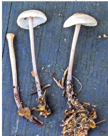
Abb. 9 Braunknolliger Sklerotienrübbling mit Sklerotien*