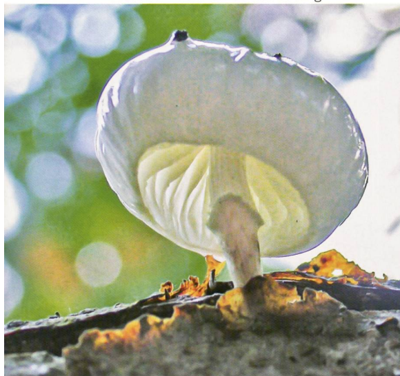
Fig. 14 Mucidula mucida Abb. 14 Buchen-Schleimrübling