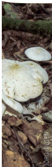
Fig. 4 Gymnopus fusipes Abb. 4 Spindeliger Rübbling

Le nom de genre Collybia n'a été conservé que pour de très petites espèces