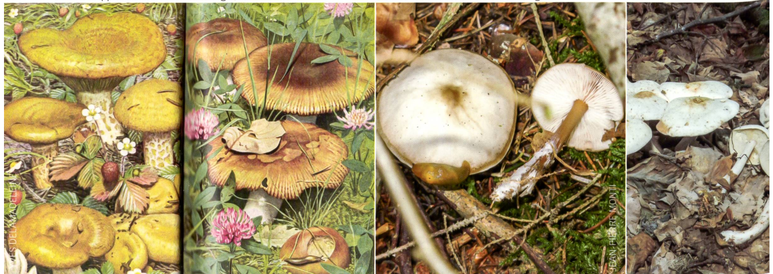
Fig. 3 Rhodocollybia maculata Abb. 3 Gefleckter Rübling