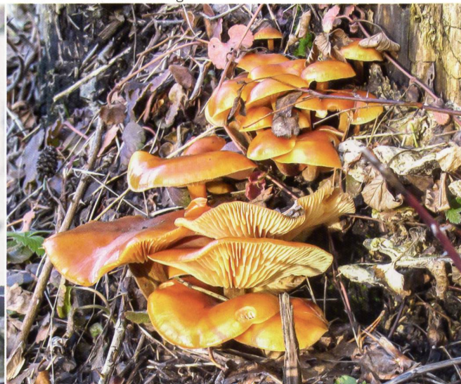
Fig. 15 Flammulina velutipes Abb. 15 Samtfussrübling