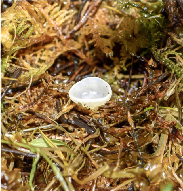
PEZIZA TAREMBERGENSIS Fruchtkörper | Fructifications