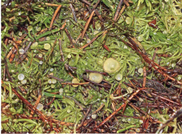
SPOONEROMYCES VELENOVSKYI Fruchtkörper | Fructifications