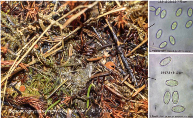
SPOONEROMYCES VELENOVSKYI (oben) und S. LAETICOLOR (unten) Fruchtkörper und Sporen | Fructifications et spores