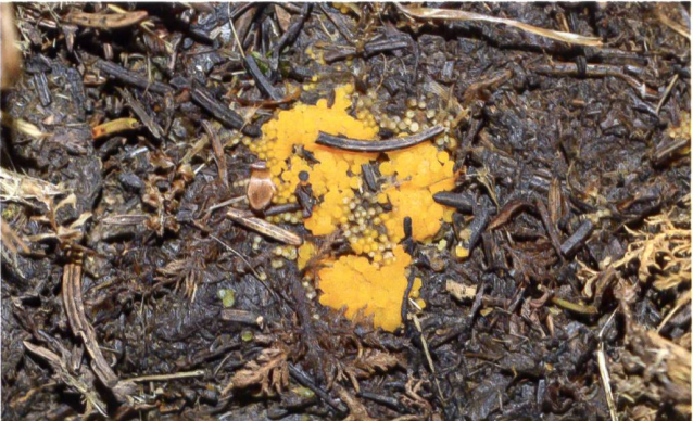
BYSSONECTRIA TERRESTRIS Fruchtkörper | Fructifications