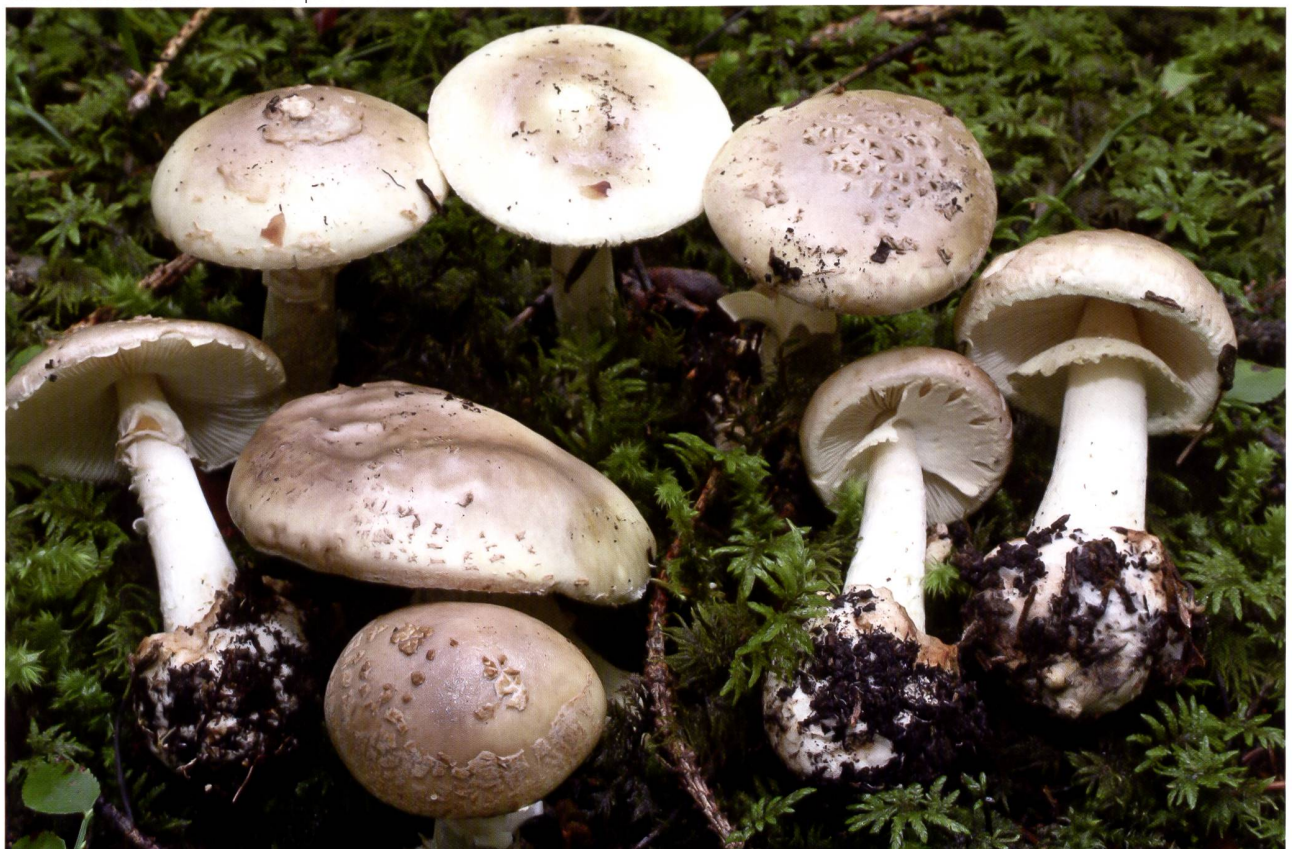
AMANITA INTERMEDIA Fruchtkörper am Standort | Fructifications sur leur station

Stiel 60–80 × 6–20 mm (Knolle bis 35 mm), zylindrisch bis konisch, gegen Basis verbreitert, voll, später hohl, faserig. Oberfläche, glatt, matt bis seidig