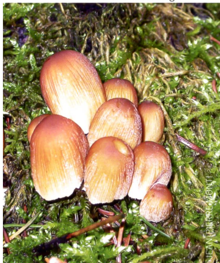
Fig. 1 Coprinellus micaceus Abb. 1 Glimmertintling