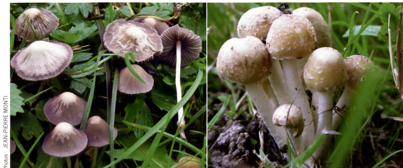
Fig. 17 Psathyrella candolleana Abb. 17 Behangener Faserling