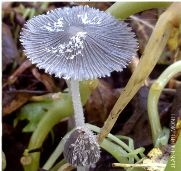
Fig. 7 Coprinopsis lagopus Abb. 7 Hasenpfote