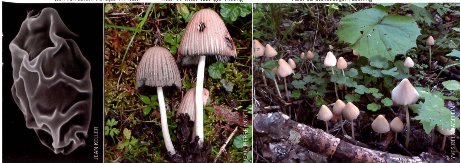
Abb. 12 Steifstieliger Faserling