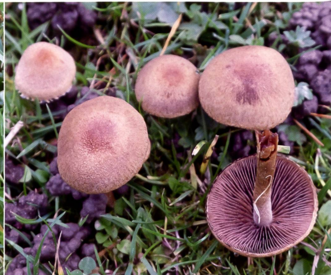
Abb. 15 Tränender Saumpilz