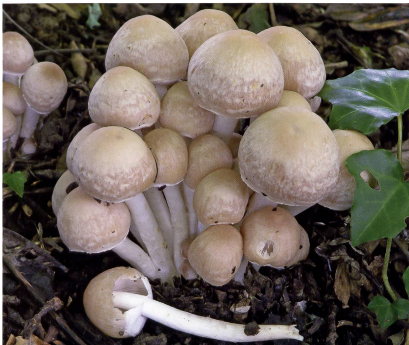
PSATHYRELLA CANDOLLEANA Behangener Faserling | Psathyrelle de De Candolle