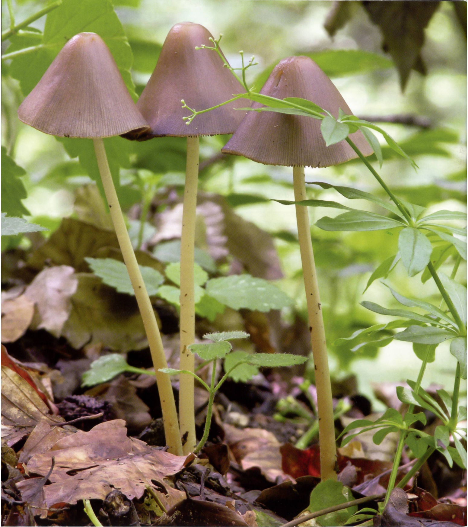
PSATHYRELLA CONOPILUS Psathyrelle à chapeau sétuleux, voir l'article à la page 16 | Steifstieliger Faserling, siehe Artikel ab Seite 22.