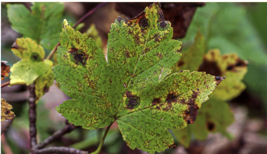
RHYTISMA PUNCTATUM sur Acer pseudoplatanus , notez l'absence de stroma entre les hystérothèques | auf Bergahorn ( Acer pseudoplatanus ): zwischen den Hysterothecien ist keine Stroma vorhanden

Dieser Runzelschorf wird auf SwissFungi nur zwei weitere Male angegeben (SwissFungi 2022). Es ist unklar, ob dies daran liegt, dass er übersehen wurde, oder ob er selten ist. Am Ende der Saison ist er leicht zu erkennen, da ihre Hysterothecien nicht durch ein Stroma miteinander verbunden sind und nur gruppierte Punkte bilden. Zu einem früheren Zeitpunkt im Jahr kann sie jedoch mit dem unvollkommenen Stadium des Ahorn-Runzelschorf ( Rhytisma acerinum ) verwechselt werden. Am einfachsten vergleicht man die Ascokarprien mit denen auf heruntergefallenen Blättern vom Vorjahr.