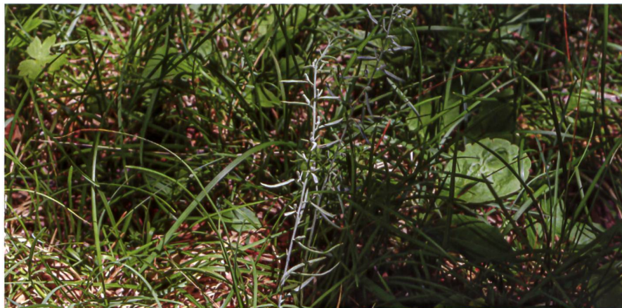
ERYSIPHE THESII sur Thesium pyrenaicum I auf Pyrenäen-Bergflachs ( Thesium pyrenaicum )

Nur wenige Oidien erscheinen so früh wie diese; alle vier Funde in der Schweiz stammen denn auch vom Monat Juli. Die Bestimmung ist einfach, weil die Art so früh erscheint und die einzige der Gattung auf diesem Wirt ist. Nicht verwechselt werden sollte die Art mit Peronospora thesij , die besonders auf der Blattunterseite wächst.