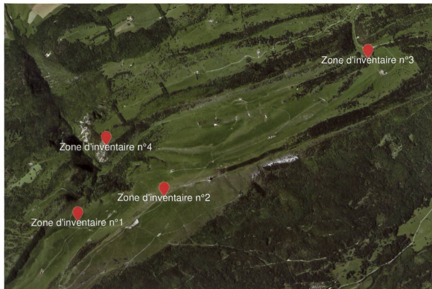
Les quatre zones d'inventaires évaluées durant l'année 2020 à 2021. Échelle 1:25000. Die vier, in den Jahren 2020 und 2021 untersuchten Gebiete. Massstab 1:25000

Die Inventarzone Nr. 1 ist ein nordexponierter Magerrasen, der von einem Bach durchschnitten wird. Die Inventarzone Nr. 2 verläuft entlang des Chasseral-Kamms und umfasst zahlrei-