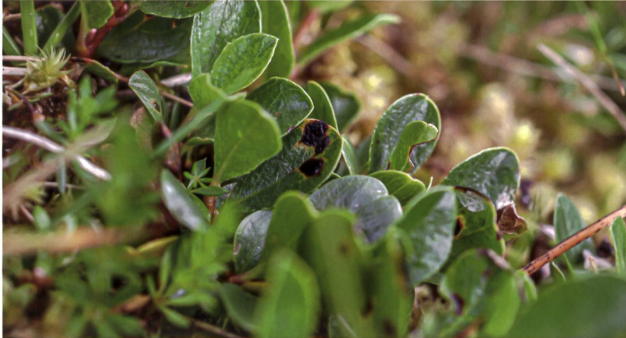
RHYTISMA SALICINUM sur Salix retusa | auf Stumpfbältriger Weide ( Salix retusa )

vorhanden ist, öffnen sich die Hysterothecien und das Hymenium mit den Ascosporen wird freigelegt. Rhytisma salicinum ist eine in der ganzen Schweiz verbreitete Art, die verschiedene Weidenarten parasitiert, vor allem aber solche aus dem Sal-Weide-Komplex. Ein Fund hier ist jedoch besonders, da er auf Salix retusa , einer Zwergweide mit alpiner Verbreitung, gemacht wurde. Der Ahorn-Runzelschorf ( Rhytisma acerinum ) ist mittlerweile als Artenkomplex bekannt (Andrin Gross, pers. Komm.). Gemäss einer Studie ist dies möglicherweise auch für die auf Weiden vorkommenden Taxa zutreffend (Masumoto et al. 2014).