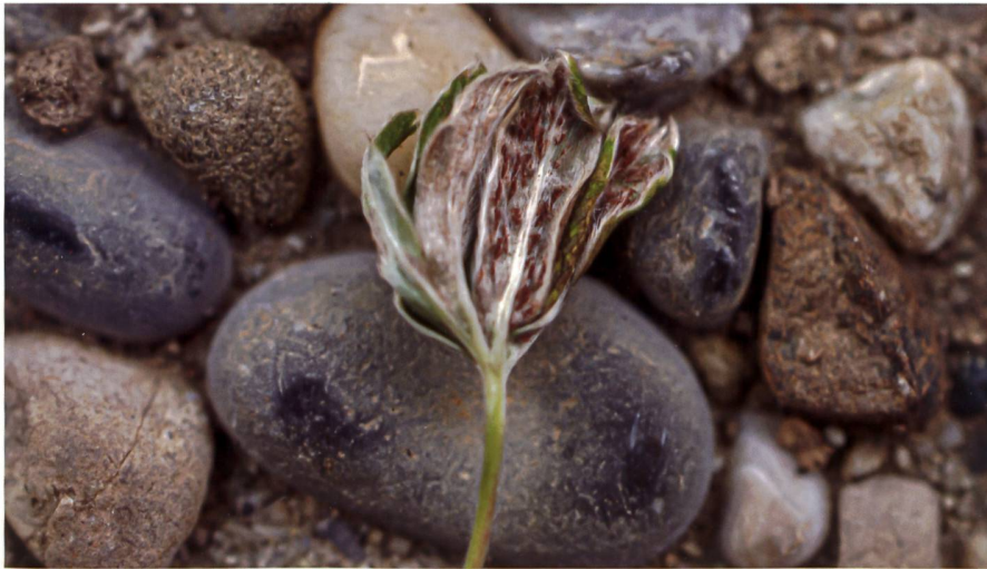
TRACHYSPOORA MELOSPORA sur Alchemilla nitida | auf Glänzendem Frauenmantel ( Alchemilla nitida )

Diese Trachyspora ist eine von drei europäischen Arten der Gattung. Es ist nicht schwierig, sie zu identifizieren, da sie die einzige Vertreterin auf dem Alchemilla plicatula -Komplex ist. Sie wurde zusammen mit Trachyspora intrusa gefunden, die auf dem Komplex des Gemeinen Frauenmantels ( Alchemilla vulgaris ) parasitiert.