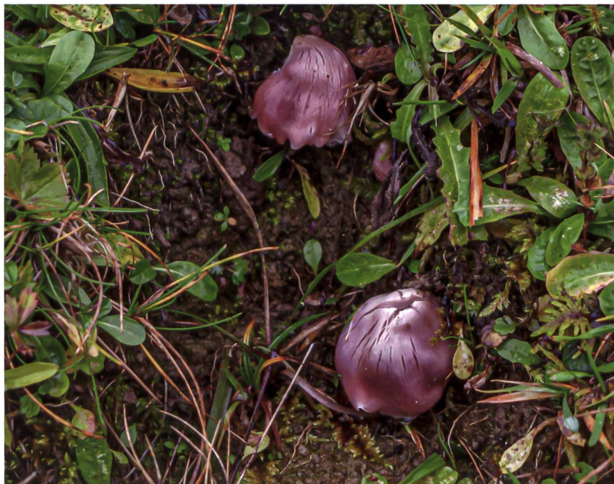
PORPOLOMOPSIS CALYPTIFORMIS apprécie l'abri que procurent les trous creusés par les sabots des vaches. Der Spitzkegelige Saftling ( Porpolomopsis calyptriformis ) wächst gern in den Löchern, die Kühe hinterlassen.

d'identification im Jahr 2018 gefunden, ist dieser seltene und schöne Saftling glücklicherweise standorttreu. Der Fund dieser Art wurde den Verantwortlichen des Naturparks mitgeteilt, damit ihr Wuchsort geschützt werden kann. Kurzfristig besteht keine Gefahr für seinen Wuchsort (Anatole Gerber, pers. Mitt.). Dies ist eine erfreuliche Nachricht für diesen Pilz, dem man viel zu selten begegnet.