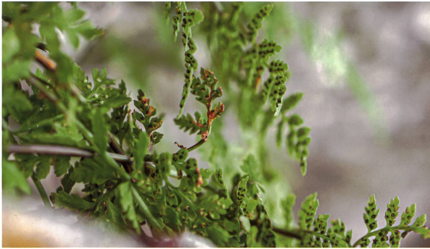
HYALOPSORA POLYPODI sur Cystopteris sp. auf Blasenfarn ( Cystopteris sp.)

zuvor in der Gemeinde Sonvilier gemacht. Sollte sich herausstellen, dass sie auf dem Berg-Blasenfarn ( Cystopteris montana ) wächst, könnte dies die Population dieser Pflanze, die auf dem Chasseral gesichtet wurde, beeinträchtigen (Juillerat & Juillerat 2014).