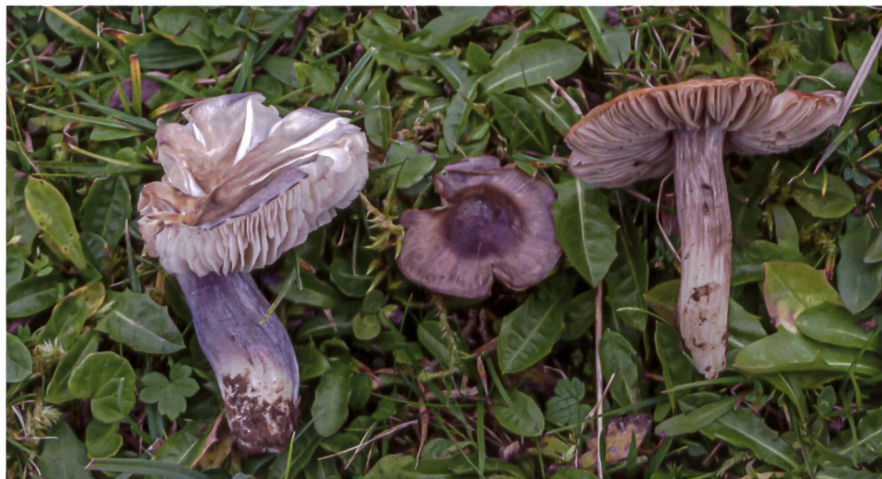
ENTOLOMA MADIDUM Trois exemplaires. La couleur bleu électrique de l'exemplaire de gauche est caractéristique. Drei Exemplare des Blauen Rötlings. Das spezielle Blau des linken Exemplars ist typisch.

Diese Stelle wird seit mehreren Jahren besucht, um das Vorkommen dieses Rötlings und der folgenden Art zu erfassen. Sie wurde während der Journées romandes d'étude et d'identification 2018 entdeckt, ist standorttreu und erscheint dort jeweils ab August. Ursprünglich wurden die Funde dieser Art Entoloma bloxamii aus derselben Artengruppe zugeschrieben. Die gefundenen Exemplare waren immer relativ alt, was zu einiger Verwirrung führte. 2021 wurde ein Exemplar mit einem wunderschönen, für dieses Taxon typischen Blau gefunden. Die Sequenzierung eines Fruchtkörpers aus den Funden von 2018 (BSI_18.169) räumte schliesslich die letzten Zweifel an seiner Identität aus.