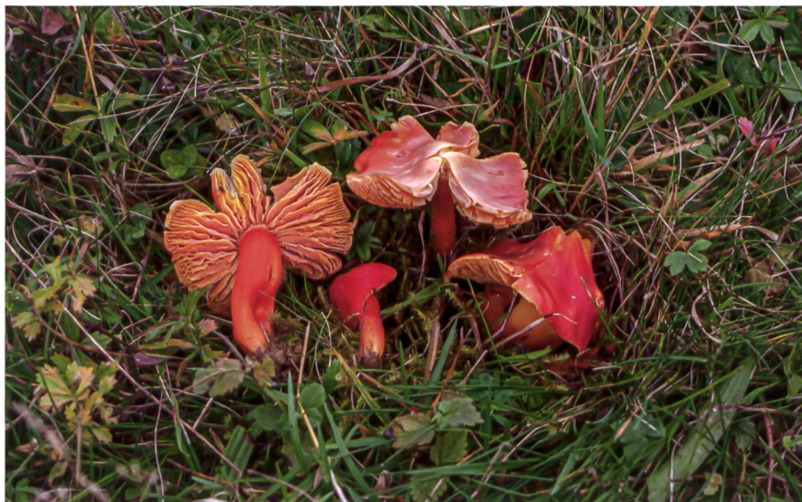
HYGROCYBE SPLENDIDISSIMA Glänzender Saftling

Dieser farbenprächtige Saftling zeichnet sich durch seine Grösse, seinen glatten Fuss und den beim Trocknen honigartigen Geruch aus. Die Exemplare waren sehr zahlreich und über ein grosses Gebiet verteilt. Dies lässt vermuten, dass es sich um eine grosse und gesunde Population handelt.