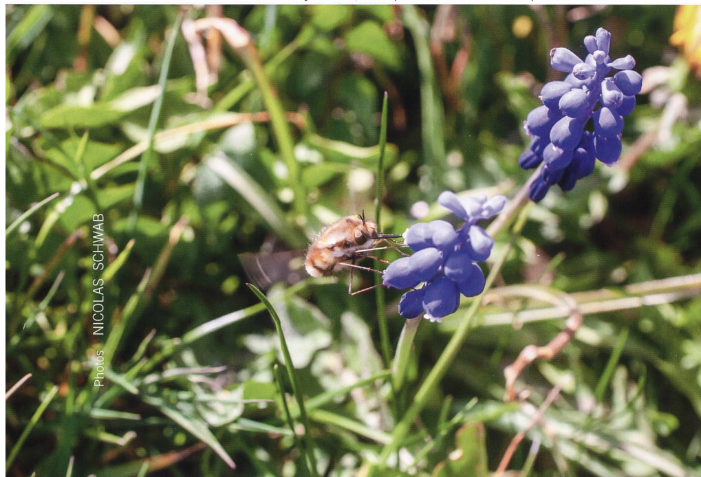
Abb. 2 Es ist schwierig, mit Antherospora hortensis infiziert dass sie mit einem schwarzbraunen Pulver gefüllt