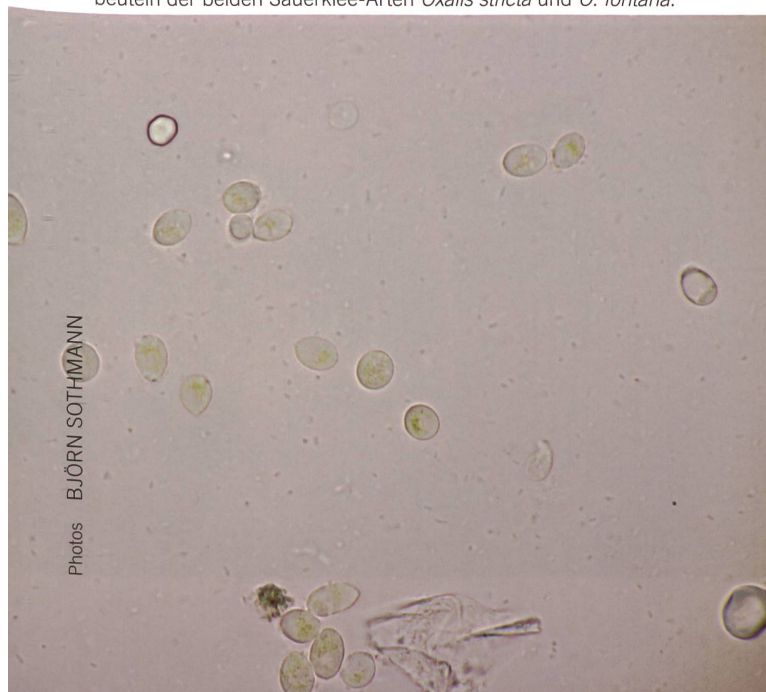
Abb. 7 Teliosporen von Thecaphora oxalidis .