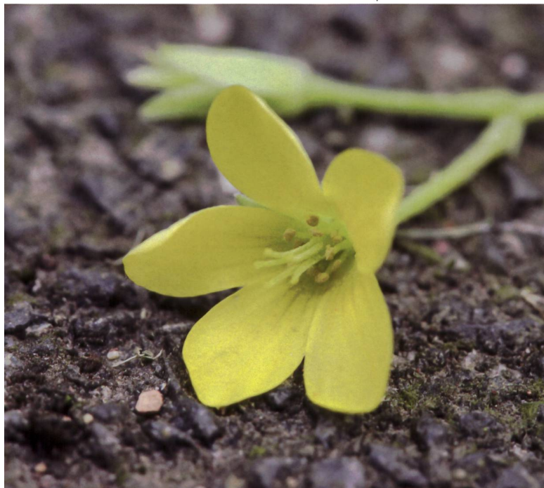
Abb. 4 Die Anamorphe von Thecaphora oxalidis auf dem Aufrechten Sauerklee ( Oxalis stricta ) ist nicht einfach zu entdecken, da die Sporen eine ähnliche Farbe haben wie der Blütenpollen des Wirts.

Pilze der Floromycetaceae infizieren nur Arten der Spargelgewächse ( Asparagaceae : Spargeln, Hyazinthen, Blausterne etc.). Die Gattung Antherospora wird in zwei Gruppen unterteilt: eine, die vorwiegend anthericol wächst, und eine andere, die alle Fortpflanzungsorgane der Blüten befällt (Vánky 2009). Weltweit sind derzeit zwölf Arten anerkannt, neun davon in Europa. Die meisten sind strikt an eine einzige Pflanzenart gebunden, einige können jedoch auch mehrere Wirte befallen. Obwohl manche Arten anhand ihrer Sporen unterscheidbar sind (Pitek et al. 2011), sind die meisten kryptisch und daher nur durch den Vergleich ihrer DNA zu identifizieren. Beispielsweise ist es unmöglich, Antherospora scillae und A. vindobonensis , die beide auf dem Zweiblättrigen Blaustern ( Scilla bifolia ) vorkommen, ohne genetische Hilfsmittel zu unterscheiden (Pitek et al. 2013). Derzeit sind in der Schweiz nur zwei Arten bekannt: A. hortensis und A. scillae (Swissfungi 2021). Es wäre aber gut möglich, dass A. vindobonensis bei den Funden der zweiten Art vorhanden ist. A. hortensis besiedelt spezifisch die Armenische Traubenhazinthe ( Muscari armeniacum ) und ist in der Schweiz ein Neomycet, da seine Wirtspflanze ein Neophyt ist. Floromyces anemarrhenae , die einzige Art der Gattung, besiedelt alle Blütenorgane des Spargelgewächses Anemarrhena asphodeloides , einer aus Ostasien stammenden Pflanze (Vánky et al. 2008).