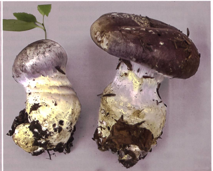
Fig. 14 Cortinarius praestans Abb. 14 Schleiereule