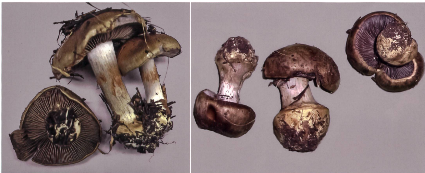
Fig. 12 Cortinarius dionysae Abb. 12 Mehligriechender Klumpfuss