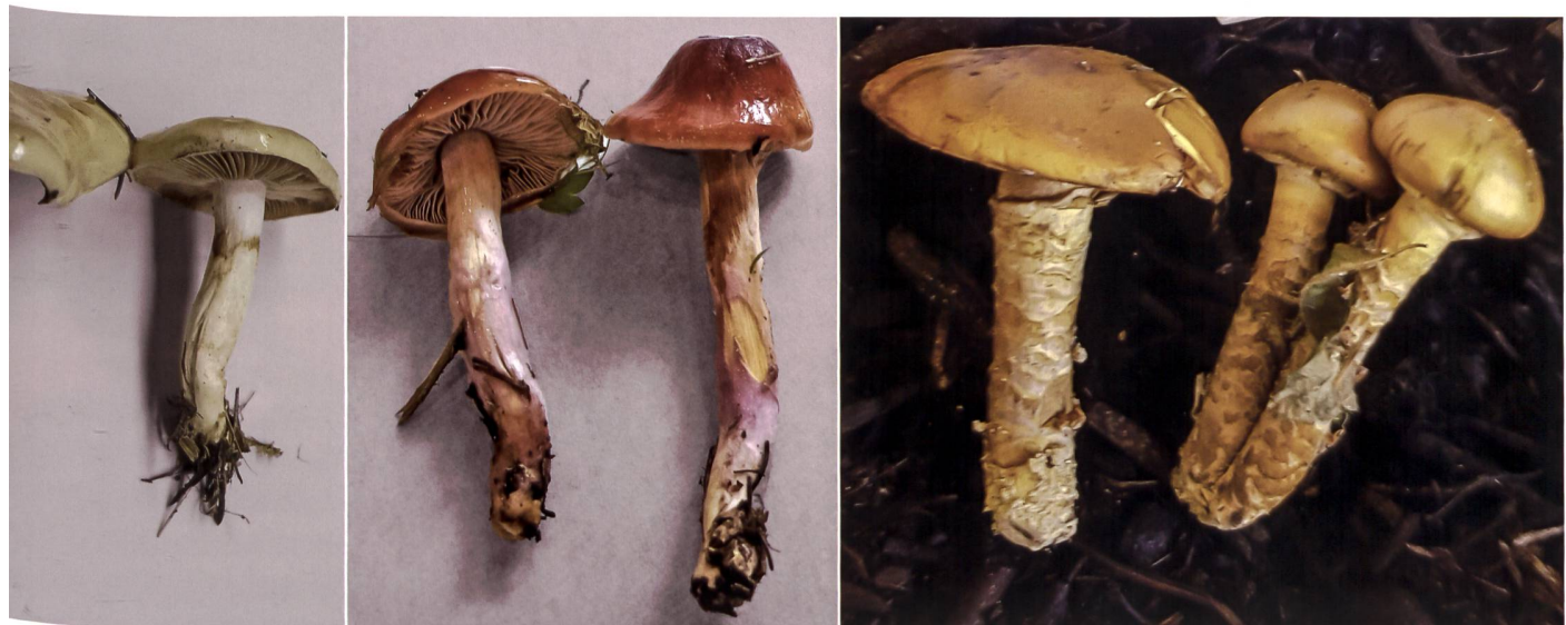
Fig. 5 Cortinarius trivialis Abb. 5 Natternstieliger Schleimfuss