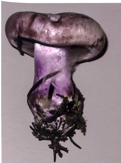
Fig. 15 Cortinarius sodagnitus Abb. 15 Violetter Klumpfuss