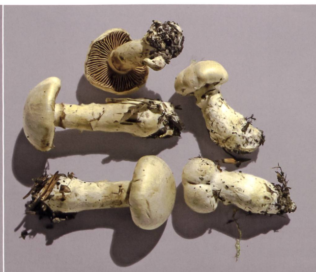
Fig. 16 Cortinarius fraudulentus Abb. 16 Trügerischer Schleimkopf