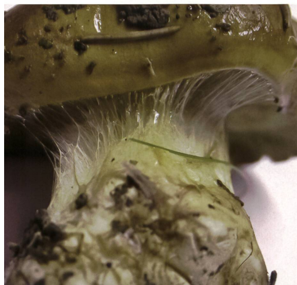
Abb. 3 Rosablättriger Schleimfuss