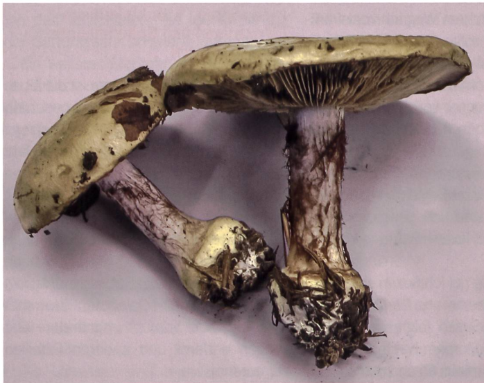
Fig. 13 Cortinarius anserinus Abb. 13 Buchen-Klumpfuss