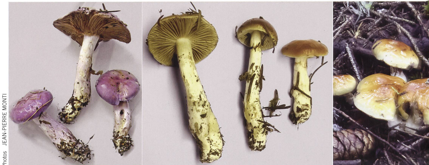
Fig. 8 Cortinarius varius Abb. 8 Ziegelgelber Schleimkopf