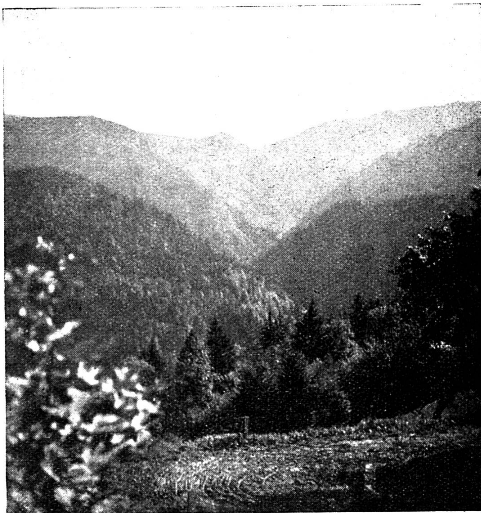
A DER QUELLE VO DER TOSS

Behördl. bewilligt am 19. 2. 42 Nr. 6384 BRB. 3. 10. 1939