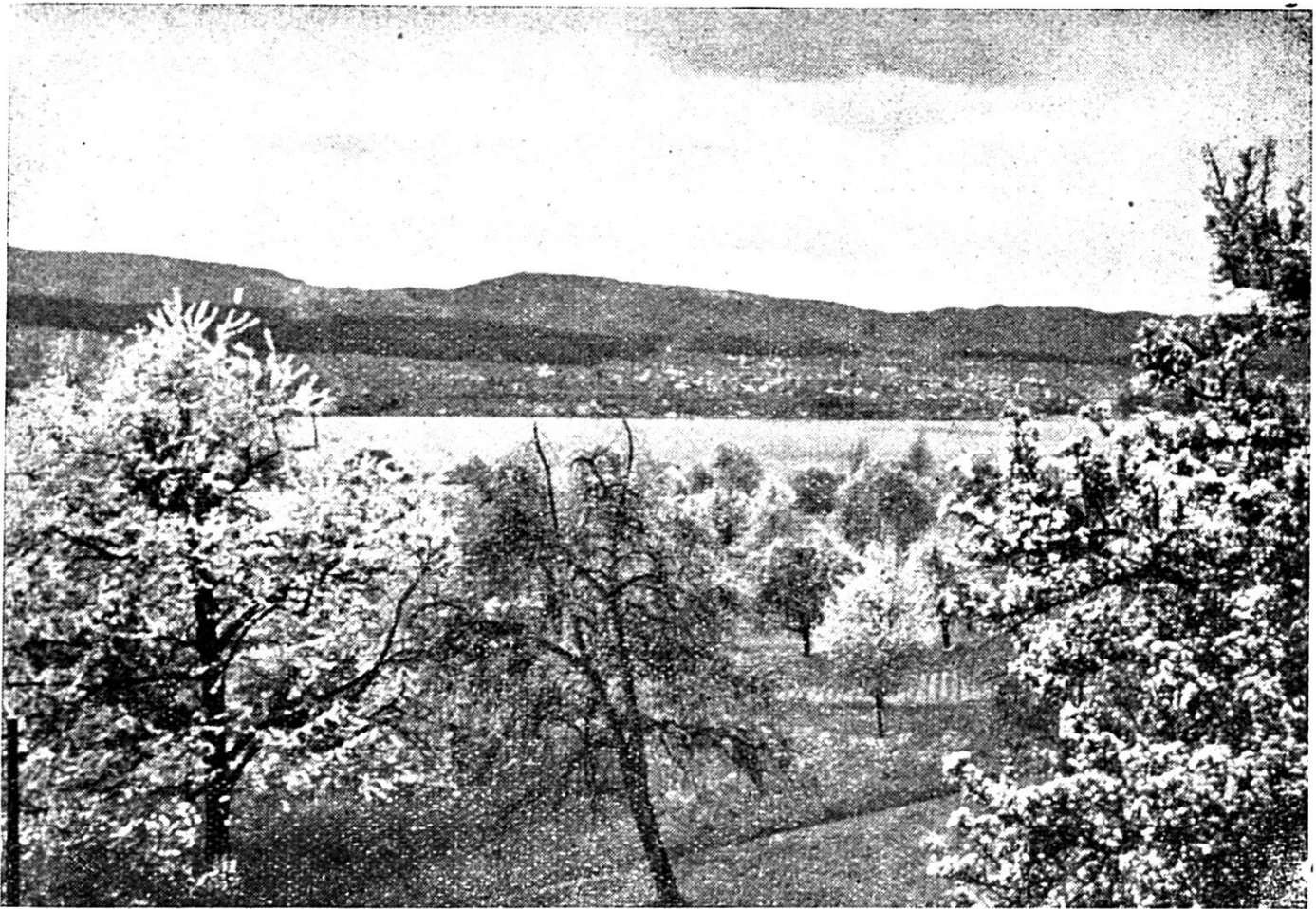
OBSTGARTE BI MEILE

Behördl. bewilligt am 19. 2. 42 Nr. 6384 BRB 10. 3. 1939