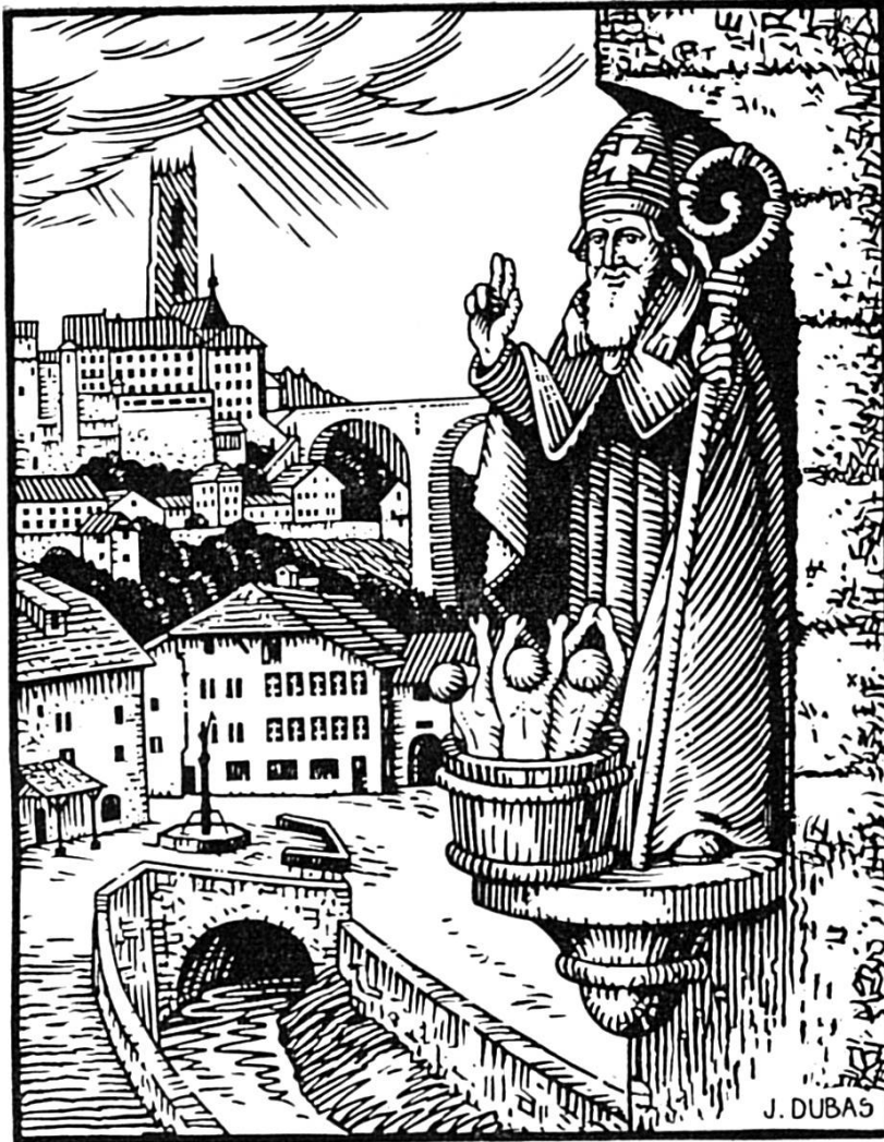
Reichlen Eugen: Der Samichlaus als Schutzpatron vo Fryburg mit de 3 arme Schüeler, won er wider uferweckt het.

verhulfe, wo Hunger und Not scho ibroche gsi si. Drum het er d'Matrosen usem Sturm grettet, wo si ihn um Hilf agrüeft hei. — Aber won er zu däm alte Metzger, zum Mönscheschlächter und syr Frau cho isch, wo het drü armi Chind gmetzget und igsalze gha, het der Samichlaus fasch nümme Geduld chönne ha. Er, wo in allne Christeverfolgunge standhaft und rüejig bliben isch, hätti dä alt Mönschefrässer am liebschte verfluecht und i di ewigi Marter gschickt. Aber au denn het er no d'Stimm vom liebe Gott und vom Heiland ghört. Er het die drü arme Schüeler wider zum Läben uferweckt und em grusige, alte Mönschefrässer und Sünder der Wäg zeigt zur Reui, zur Bueß und zum neue Läbe.