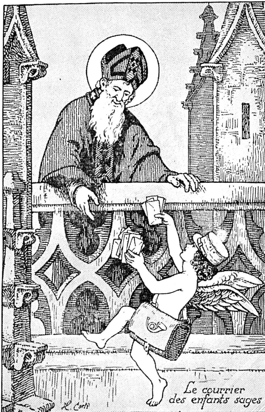
Reichlen Eugen: Der Samichlaus luegt vom Santichlausturm us e chli sym Umzug zue.

So geit de Zug wifers und chunt zletscht uf e Liebfraueplatz, wo alli die Läbchueche- Brätzeli-, Chestele- und Gfätterlizügständ di Chind ganz gsturm und glustig mache. Vom Chornhussaal us het der jung Kollegianer-Samichlaus sy Festred, a der er i der letzte Wuchen ume gstudiert het. Er leit de Chinder grütlech a ds Härz, wie si sölle lieb und brav si usw. und wenn er öppe