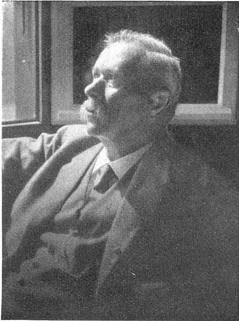
Der Dichter Simon Gfeller

u säge mer: Bis du no froh! Es isch der mängs dernäbe ggange, doch hätt's no dümmer chönne goh!