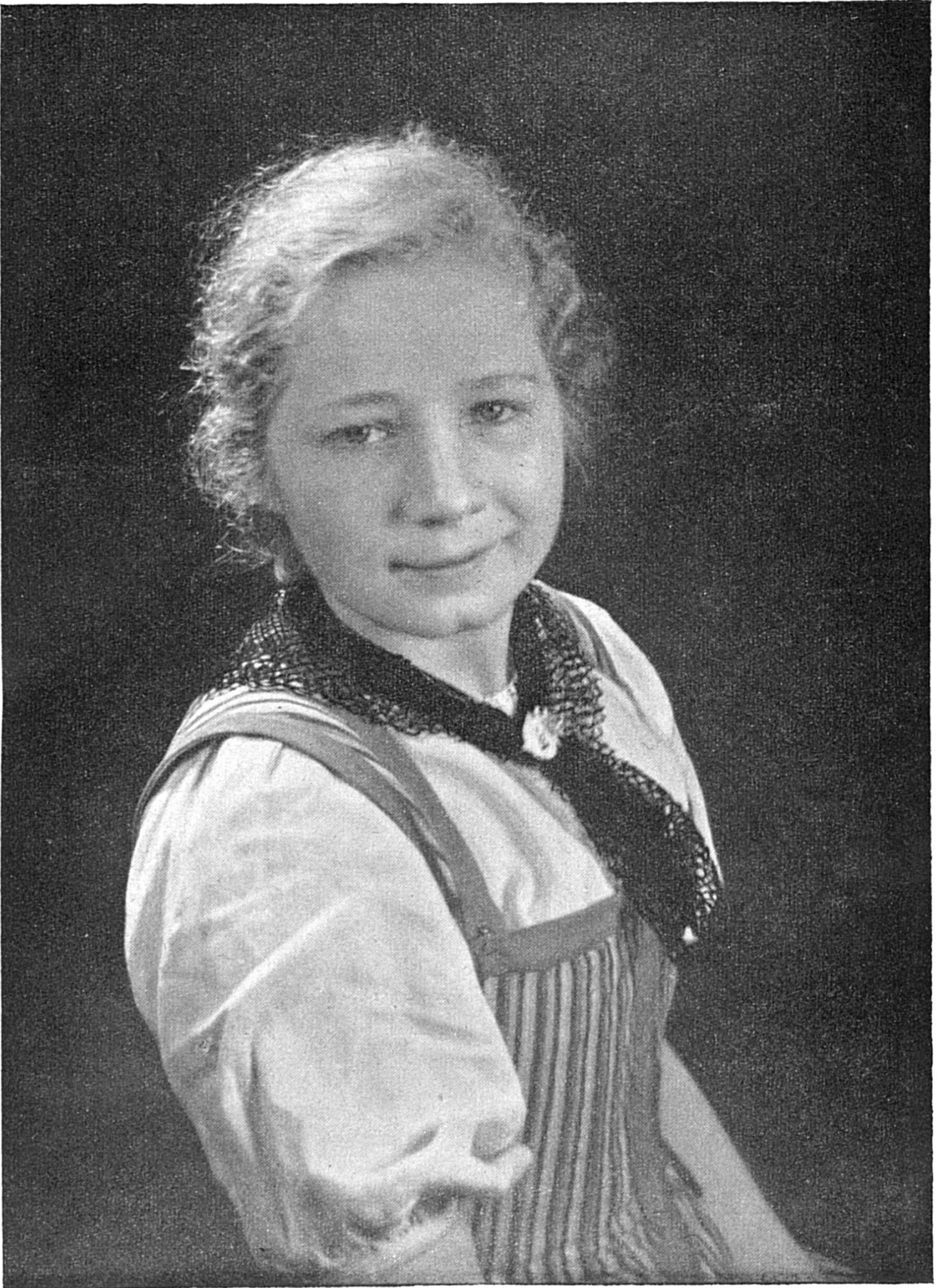
Es Ämmitalermeitschi i der Arbeitstracht