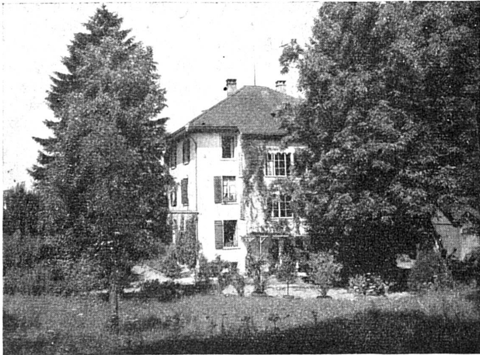
Das Länzbiger Dokterhus (1900—1931).

gsi, und si brichtet einisch, winer iri Vårs härgno heigi: