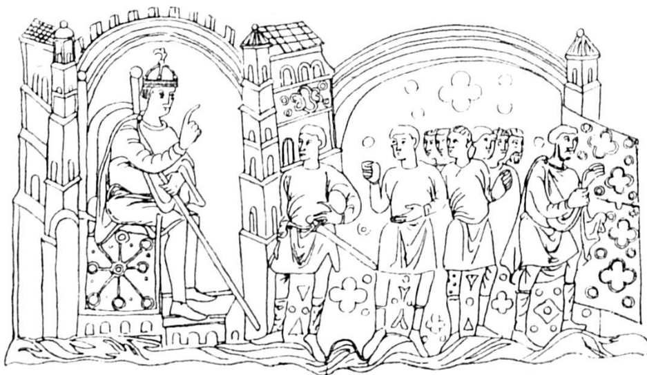
Der thronende David und seine Heerführer. (Aus dem Psalterium aureum, 9. Jahrhundert, Stiftsbibliothek).