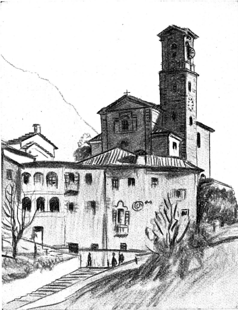
IM TESSIN (us Sunneland)