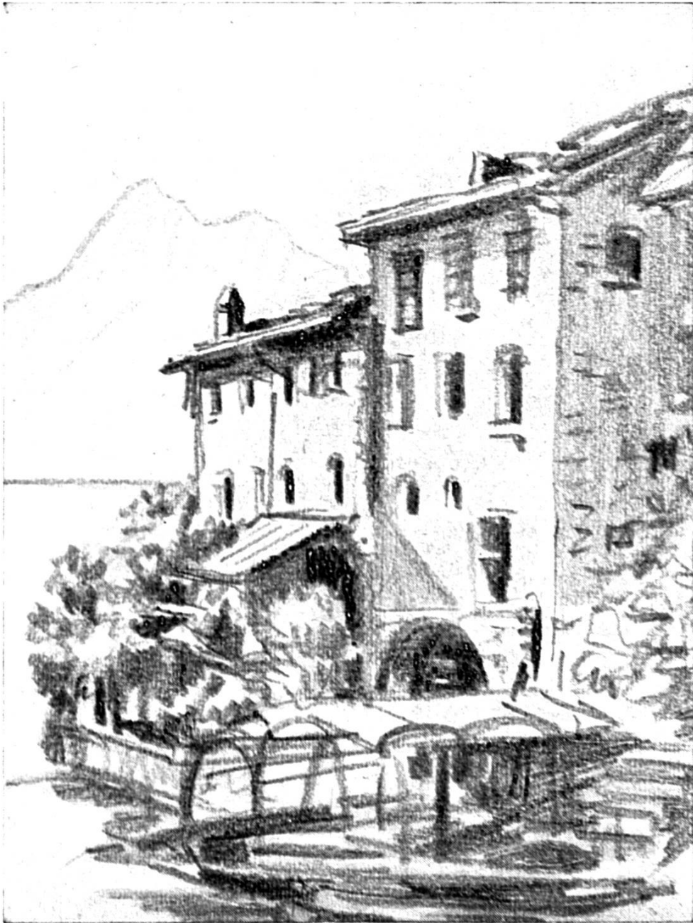
IM TESSIN (us Sunneland)