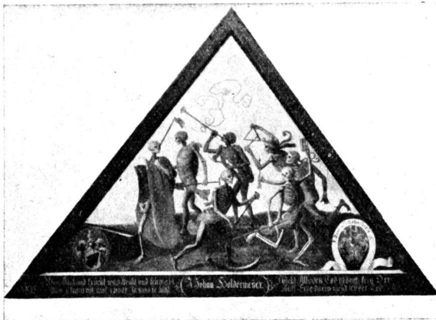
Luzärn: Eis vo de berüemte Totentanzbildere i de Spreuerbrugg