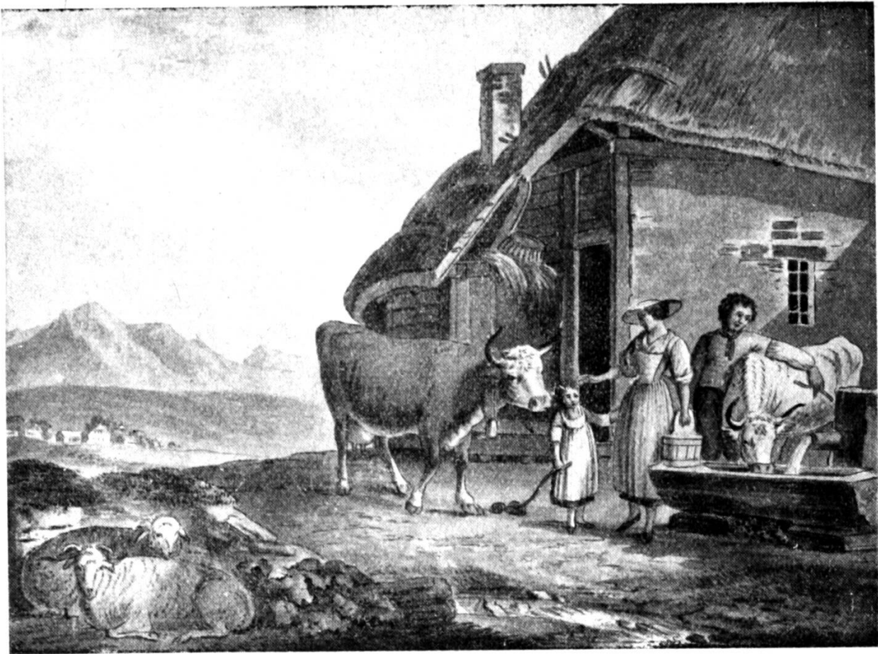
Uf em Land

het ems agseh, as er chrank ischt, und d Frau het em immer wider gseit, as ihre dä Wueschte ned gfalli, und as s am beschte wär, wenn är zum Dokter gieng. Sie het lang müesse an em greschte, bis er äntlech amene Sundig no de Chile zum Dokter ischt. Dä het e grüntlech undersuecht und zuen em gseit: «Worum chömet der erscht jetz zue mer? Dir heit d Lungeschwindsucht, und das ischt e Chranket, wo mit sech ned lot gspasse. Aber s' ischt eister die alt Gschicht: d Lüt chöme gwöndlech erscht zum Dokter, wenn s z spot ischt.» De Frank het em druf gantwortet: «Bis vore me halbe Jahr bin i no chärngsund gsi und i ha miner Läbtig non ekeis Dokterzüg gha. Das ischt au de Grund gsi, worum as mer ned prässiert het zuen ech z cho. I gsehen es hüt i, as i de Frau hätt selle folge; sie het mer nämlech scho lang und immer wider gseit, i sell zum Dokter.» — «Das wott ech usdrücklech gseit ha», fährt de Dokter witer, «eui Chranket ischt erblech, und wäge dem mueß mer weiß wie uf passe, as ech d Frau und d Chind ned au no lungeschwindsüchtig wärde. Do heißt s schwär uf passe, as der vo eune Famili-