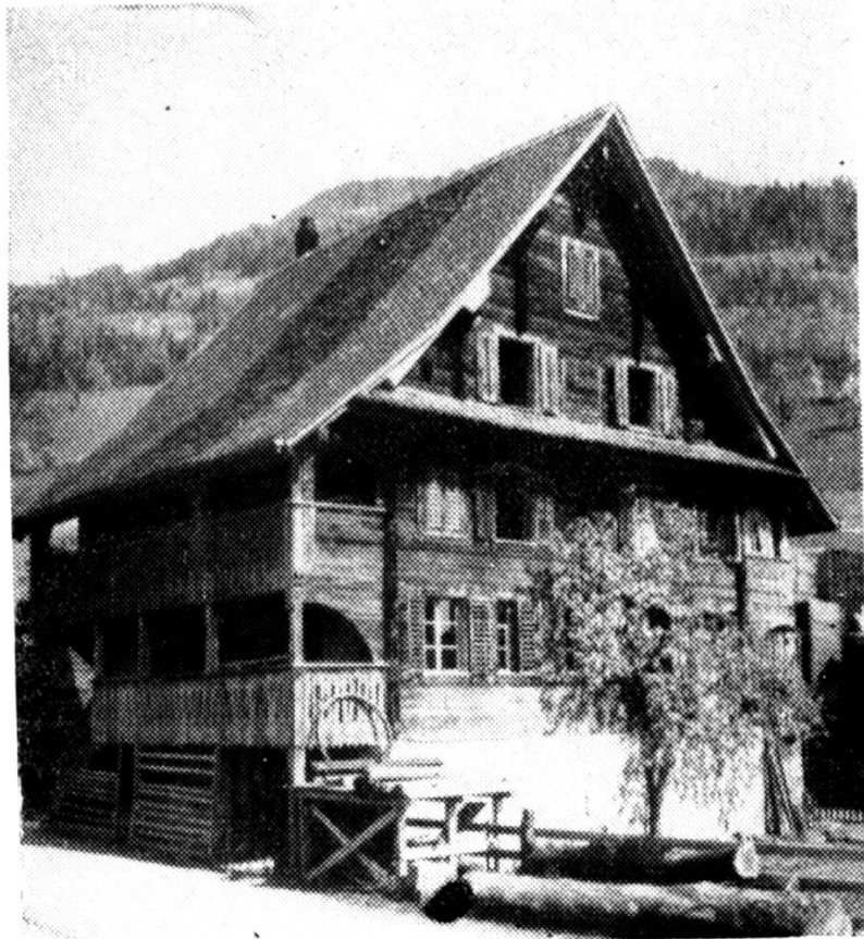
Es währschafts Hus

Wi si di Buebe froh gsi, wo si gseh hei, as d Bürene mit em Zobigchörbli gägem Chornblätz zue chunt z laufe. 'Am Waldrand unde ischi a Schatte gstande und het dene Ähriufläse greüft. De Seppi und de Dolfi si i länge Sätze abegsprunge und hindenoche isch s Theresi trämpelet. Wo dene Buebe das Burebrot so guet gschmöckt, het s Theresi gseit: «Luegit Buebe, us dene Ähre, womer ufläse, wird au Brot gmacht, drum söttider flißig si.» Di zwe hei dä Zuespruch scho gmerkt, hei i de Bürene danket und si ufgstande, as wette si a d Arbet. Wo d Bürene wider abwärts glaufe, heiseren e schöne Juzger düre Wald abnagschickt. Schön heisi s chönne und wo si gseh, as s Theresi au Freud het gha und mit Mul und Nase zueglost, ischne z Sinn cho, däm guete alte Wibli no äxtran es paar Liedli z singe. De Seppi het agfange und de Dolfi het mit zweute Stimm igsetzt: «Ich bin ein Schweizerknabe». Wi schön het das tönt dür s Tobel ab. S Theresi isch am Waldrand ghöcklet und hetne gar andächtig zueglost. «So, Theresi, was seisch derzue?» het de Dolfi gfrogt, wo s Lied fertig gsi. «Schön isch es gsi, schön — heit rächt Buebe, singit nume, s chunt e Zit, wo dr nümme mögid singe, no gli gnue chunt si.» Jetzt isch s Theresi zu sim Ährisack