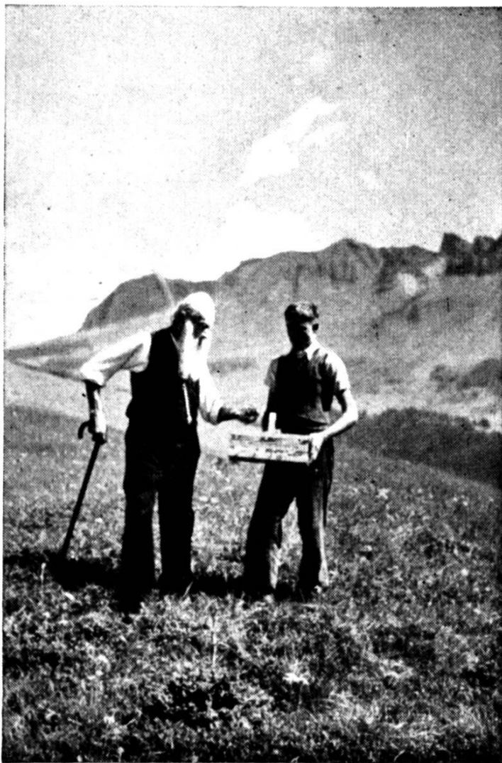
I der Hergottsapotheke

Jo gottlob, kei menschliche Nachtüüle und Kultur-Lüüs hand ihm döt d'Ruoh und de Fride gstört. Kei Autohuppe, kei Töff, kei Klavier und kein Hond hand glärmet. Alli stolze Bergrise rondon hand de Patriarch vo Zizers kennt, au alli Bluome uf de Alpe. Er hätt sich am meiste mit dene onderhalte und sich mit ehne gfreut. Am Morge om di föfi ome hätt er im verwiterte Chappeli vo Sant Martin d'Meß glese und vo döt us allne sine Patiente de Säge geh.