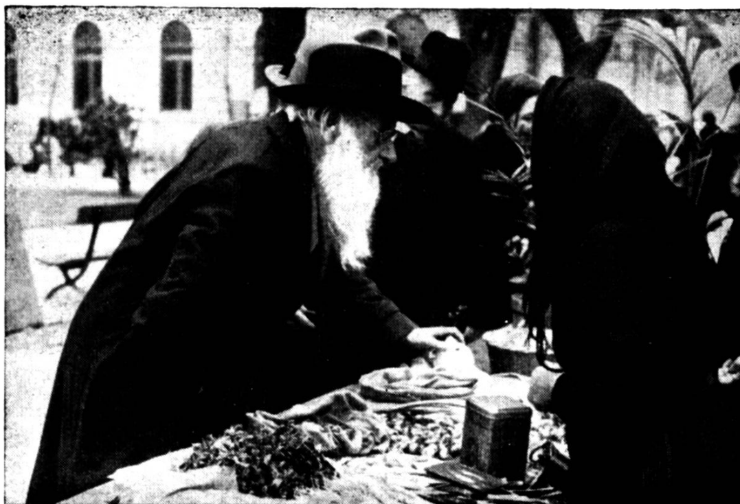
Der Chrüterpfarrer uf em Märkt z'Locarno

Mol muond er mir kei Tör me ufmache, i bi alt gnuog derzuo, daß is selber cha! De Portier ist ganz vedutzt gsi über das ugwohnt Atrete.