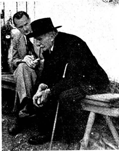
Uff em Bänkli (A.F. frogt ne alte Ma us)

O Müder, müj doch 's Wüldli wüg, Wo mir so vill gsi si; As igs emol vergässe cha, Das Meitli sig nit mi.»