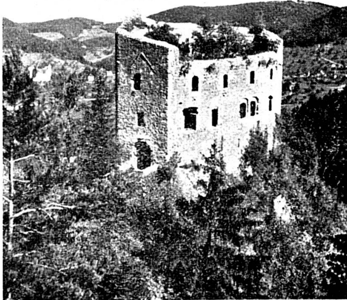
Schloss Gilgebürg bi Nunnige