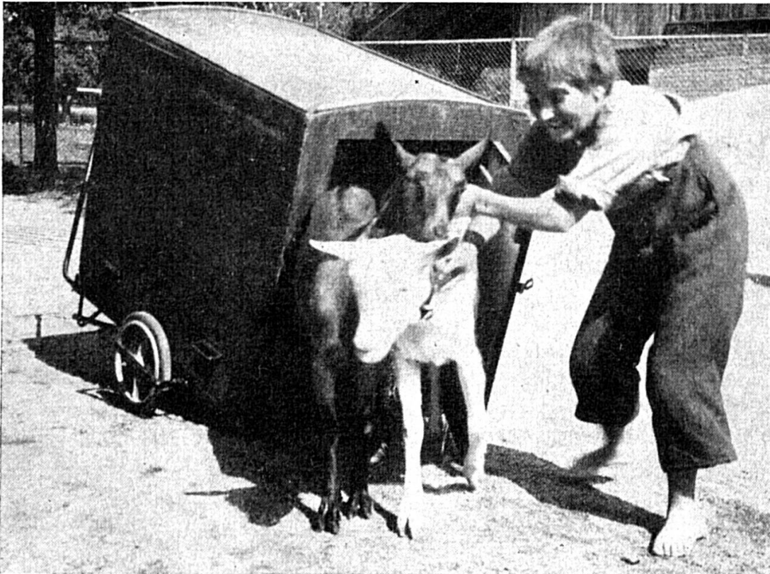
Bim «Heidi» wärde sogar d'Geisse mitbracht