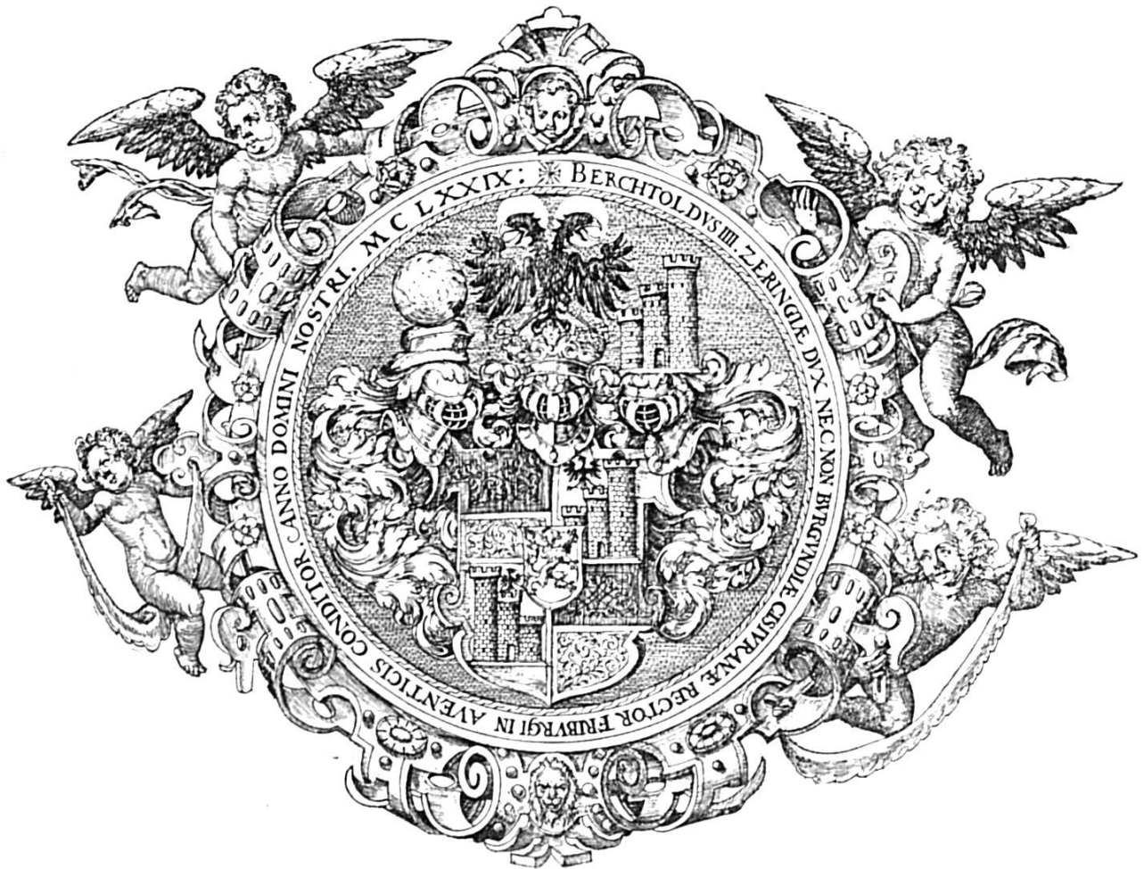
Schweiz. Archiv für Heraldik, 1903