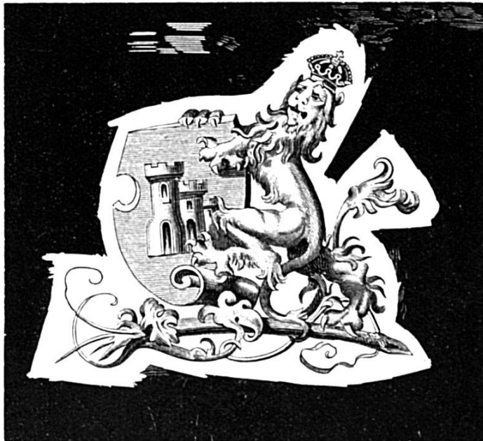
Ds Wappe vo de Zähringer mit de drei Türm vo Fryburg

Früech am Morge bim Verwache Faht der Chöhler afa lache: «Herr, Ihr sid i dFärbi grate. Eh, i chan Ech nid guet rate. Schwarz und wyss si Euji Chleider, Doch sie si destwäg nid leider. – I eim Sack het's nüd als Chohle, – Söll i Euch chli Wasser hole? – Und der ander isch vermählet . . . Herr, i gloube fasch, Ihr schmälet?» . . . «Schwarz und wyss», seit Fryburgs Gründer, «Das isch rächt, sig baass, du Sünder! Fryburg het sys neue Wappe, Male müesse's hütt no d Knappe. Zeig mer jitz der Wäg a dSaane, Fryburg het sy eget Fahne!» – Schwarz und wyss isch Nacht und Tag . . . Isch das nid e schöni Sag?