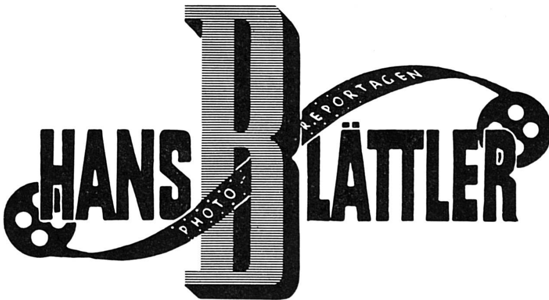
PHOTO- UND CINÉGESCHÄFT

Gmeint ist das i Stadt und Land bestbekannti