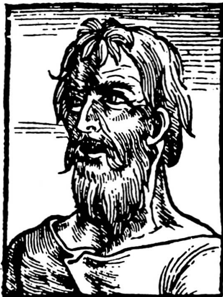
Bruder Klaus, aus der Schweizer Chronik von Johannes Stumpf, 1548