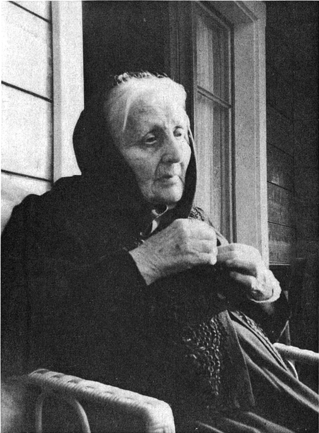
Die Mutter des Autors. (Von ihr habe ich die Gabe des Erzählens geerbt.)

Mit de Jahru heint immer meh Ziiige und Ziitschrifte mini Erzelige und Gidicht gibrunge, und zweimal hani anam Wettbiwärb in Ditschland du erschtu Priis percho. (Das heisst: Du Priis sälber heint mer di brüunu Gsellu, wa dazumal dana dum Rhy zbfählu gka heint, nie la züecho...)