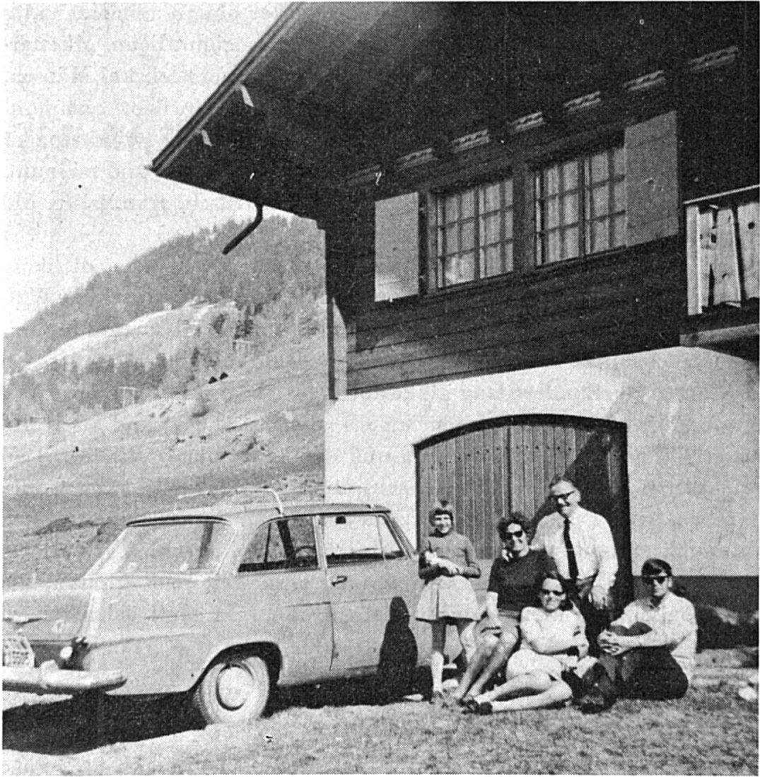
Am besten erhole ich mich im Kreise meiner Familie.

Kurzwällusänder!) mini Heerspill gkehrt und das Wallisertiitsch heigi ihne unändliche Freid gmacht. —