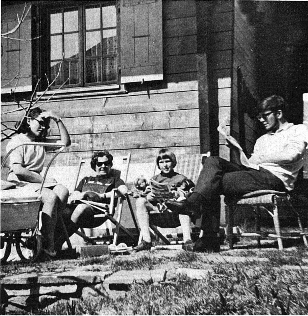
Die Familie des Autors in den Ferien.