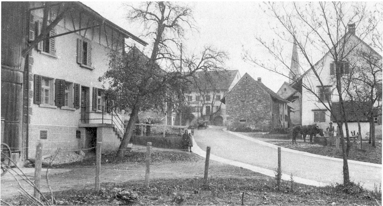
Abb. 22: Postkartenansicht von Niederneunforn in den 1880er-Jahren. Die Hypothekenbank verzichtete 1884 in einem Gerichtsprozess auf die Hälfte ihrer Geldforderung an das stark verschuldete Dorf.

ohne dass damals etwas Besonderes vorgekehrt wurde. 342 Im Jahr 1884 sah das freilich anders aus.