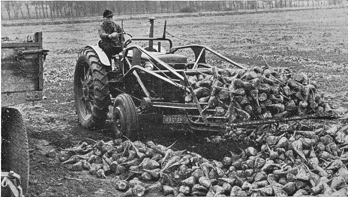
Elévateur frontal utilisé pour charger les betteraves déjà mises en tas.

parties soumises aux plus grands efforts ou utiliser du matériel plus résistant. On peut par exemple très bien décharger les betteraves à sucre dans les wagons; pour cela il faut disposer d'un quai de déchargement assez haut pour que le pont du char arrive au-dessus du cadre du wagon. On peut aussi décharger les betteraves dans les wagons sans quai de déchargement, mais dans ce cas il faut modifier la position de la fourche. L'amélioration continue des outils permettra de trouver de nouvelles possibilités d'utiliser cet engin.