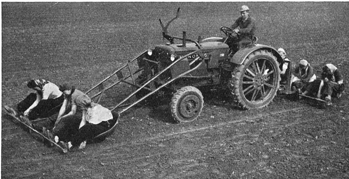
Démariage des betteraves en vitesse rampante. Travail simultané sur 7 lignes. L'élévateur frontal a 3 sièges, tandis que l'arrière du tracteur est aménagé pour transporter 4 personnes.

En chargeant du compost avec l'élévateur, on utilisera la fourche pour le premier char, la pelle pour le second, la fourche pour le troisième, etc. Avec cette alternance, le compost est défait et chargé proprement sans interrompre le chargement d'un char. L'échange de la fourche et de la pelle se fait très rapidement et facilement.