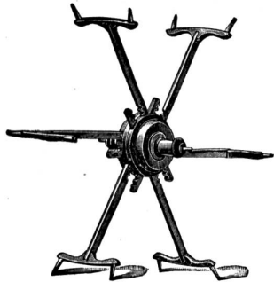
✚ 14955 S. G. D. G.