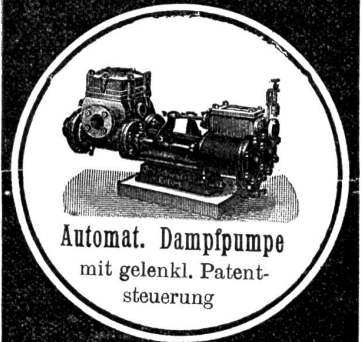
Automat. Dampfpumpe mit gelenkl. Patent- steuerung