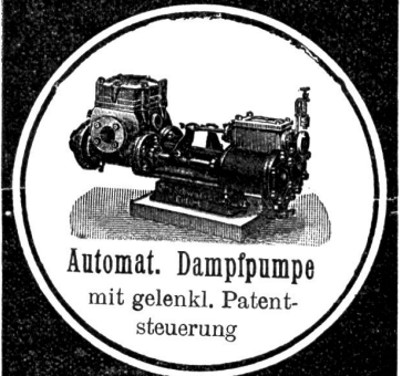
Automat. Dampfpumpe mit gelenkl. Patent- steuerung