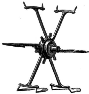
+ 14955 S. G. D. G.