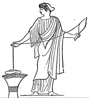
Abb. 5. Griechische Spinnerin (etwa 500 v. Chr.)

Ovids beredete Schilderung gibt uns ein anschauliches Bild der Technik der altgriechischen Webekunst und der Art ihrer Erzeugnisse. Müssen wir doch die Webebilder, die Athene und Arachne in ihrem Wettstreit schufen, als eine Art Go-