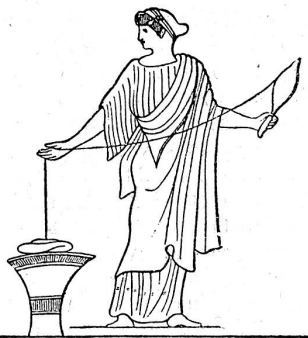
Abb. 5. Griechische Spinnerin (etwa 500 v. Chr.)

Ovids beredete Schilderung gibt uns ein anschauliches Bild der Technik der altgriechischen Webekunst und der Art ihrer Erzeugnisse. Müssen wir doch die Webebilder, die Athene und Arachne in ihrem Wettstreit schufen, als eine Art Go-