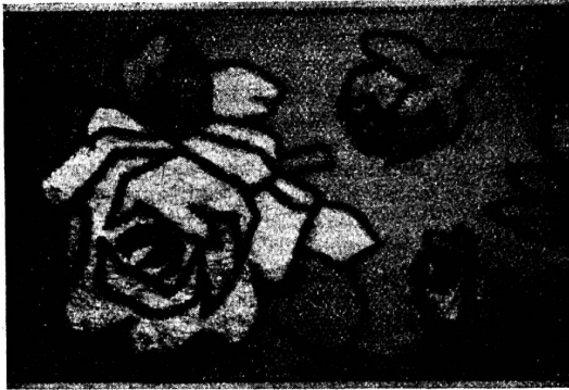
Satin imprimé, Rosen und Knospen mit Velours-Effekten.

Die neuesten Façonnés-Artikel, die auf den Markt gebracht werden, weisen immer noch die gleichen Dessins auf. Große Beliebtheit scheint den Bändern mit Velours-Effekten entgegengebracht zu werden und werden für diese Artikel geometrische Figuren und auch Blumendessins gewählt.