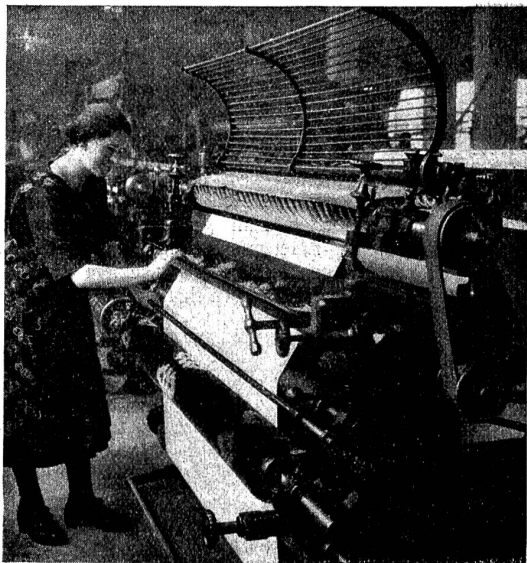
Wolltuchfabrikation: An der Schermaschine. Die aus dem Gewebe hervorstehenden Enden werden gleichmäßig abgeschnitten.

2,431,000 Meter), im Großhandelswerte von 36,9 Millionen Fr. (1899/1900: 10,4 Millionen Franken).