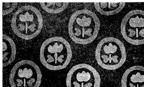
II. Crêpe impr. (mit kleinen Blumen-Effekten).