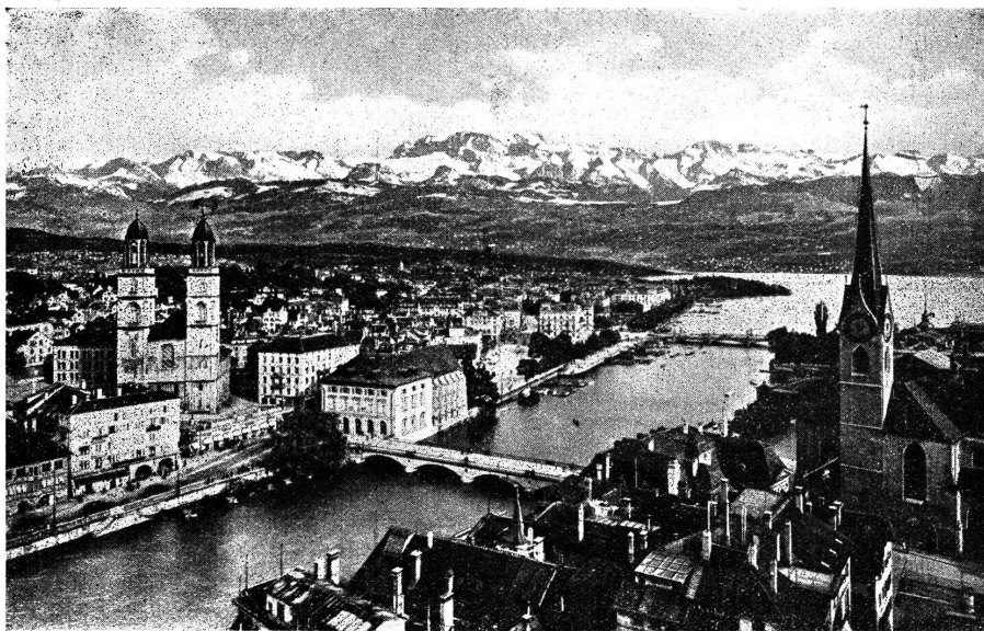
Zürich — die Stadt der Schweizerischen Landesausstellung

Von Jahr zu Jahr wurde die Stadt größer und — man darf es ruhig sagen — auch schöner. Nach allen Richtungen entstanden breite Hauptverkehrsstraßen und in allen Quartieren auch hübsche Anlagen. Im Laufe einiger Jahrzehnte wuchs die Stadt mit ihrem zweiten Vorortkranz vollständig zusammen. Am 1. Januar 1934 wurde gemäß Beschluß der beteiligten Gemeinden in öffentlicher Volksabstimmung die Vereinigung der bisherigen Vororte Leimbach, Albisrieden, Altstetten, Höngg, Affoltern, Oerlikon, Schwamendingen und Witikon mit der Stadt vollzogen. Die Bevölkerung der Stadt Zürich wuchs dadurch um etwa 90 000 auf rund 310 000 Per-