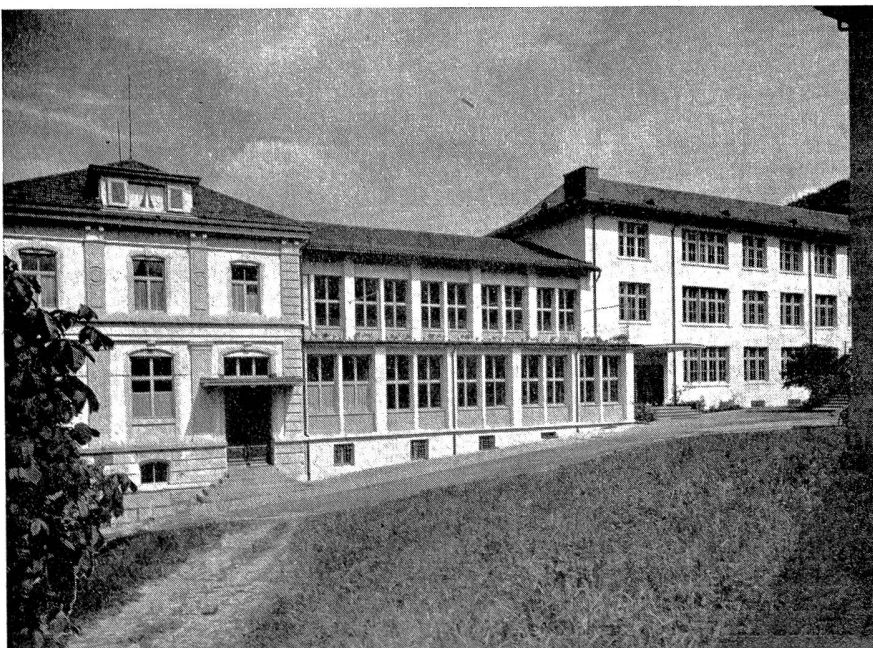
Webschule Wattwil Links: Verwaltungsgebäude; Mittelbau: Zeichnungssaal, im Parterre, darüber der große Hörsaal. Rechts: Haupteingang und Unterrichtsräume.