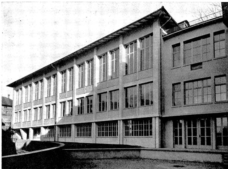
Neubau, Westfassade Parterre: Streichgarn-Spinnerei und Werkstatt. 1. Stock: Weberei-Vorwerke und Zwirnerei. 2. Stock: Websaal.