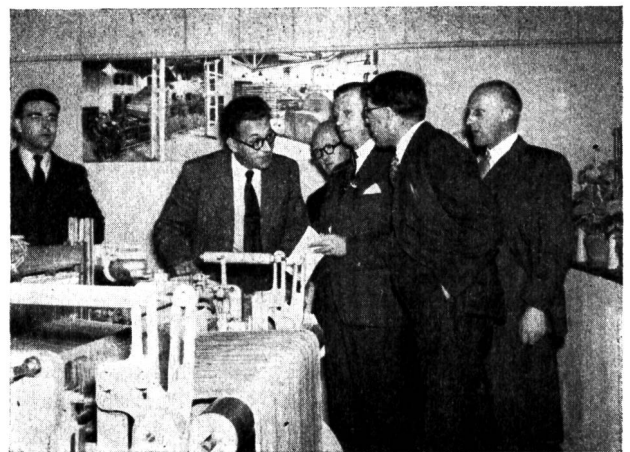
In der Textilmaschinen-Halle der Schweizer Mustermesse