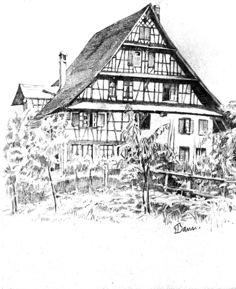
Der untere Sennhof in Kappel, das heutige «Näfenhaus»

In technischer Beziehung hat unsere Industrie große Wandlungen durchgemacht. Der schmale mechanische Webstuhl, der die Herstellung von Geweben bis zu 60 oder 70 cm Breite erlaubte, folgte dem alten Handwebstuhl. Jahrelang hat er gute Dienste geleistet, bis die