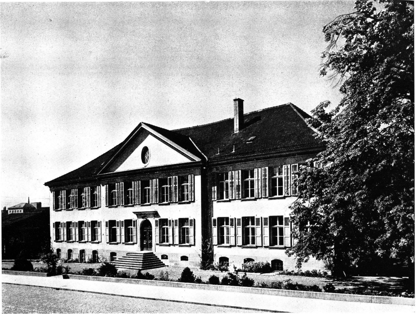
Die alte Seidenwebschule in neuer Umgebung